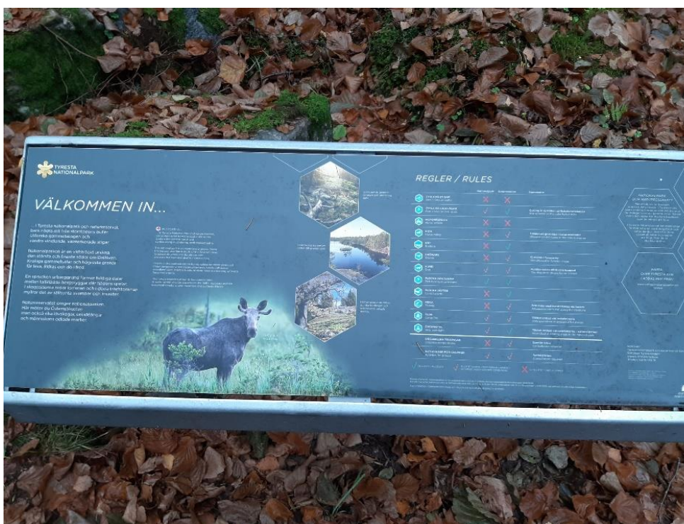
En skylt visade att vi var på gränsen till Tyresta nationalpark.