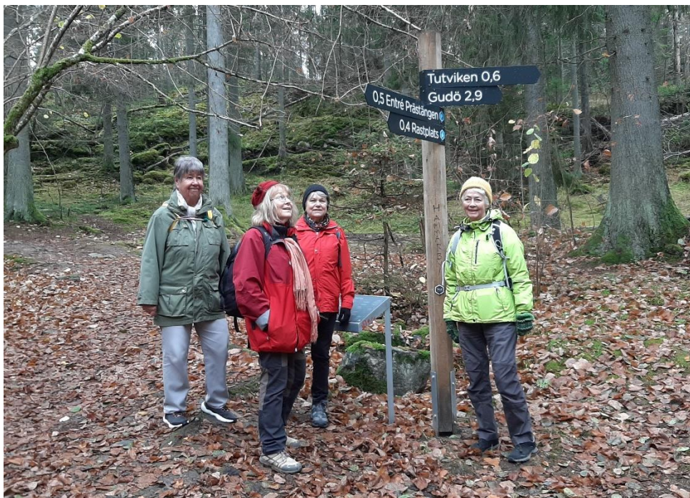
Men vi skulle gå tillbaka utefter Långsjön mot Gudö.