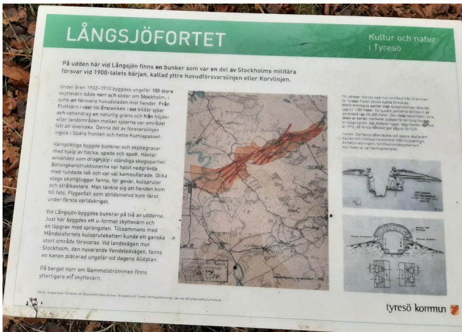
På några platser vid sjön finns gamla försvarsanläggningar kvar.