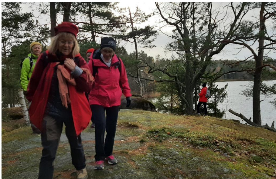
Här inspekterar vi Långsjöfortet, en u-formad anläggning på en udde med grävda skyttegravar och värn.