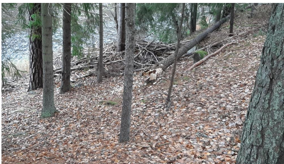
På sydsidan av sjön såg vi spår av bäver.