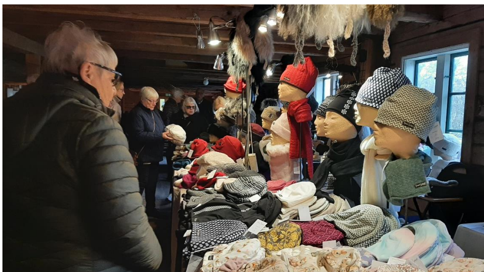
Det var ganska ruggigt väder, så de fina mössorna fick flera köpare.