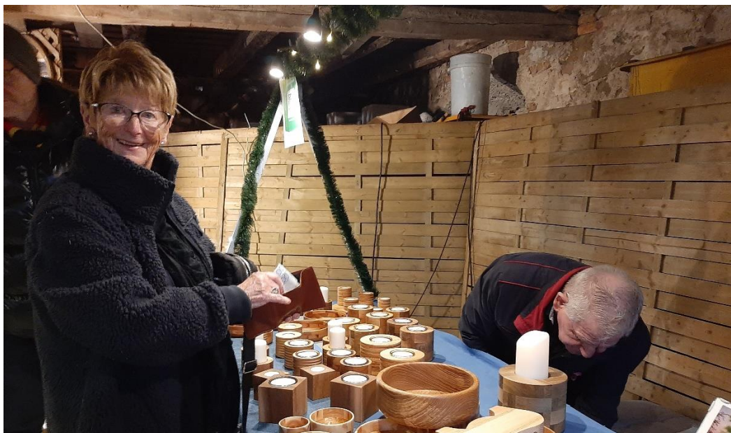
Några passade på att fynda bland de många fina föremålen.