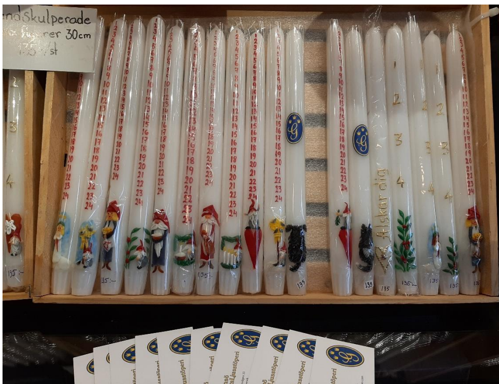
Hemstöpta ljus i olika former, varav en del var dekorerade som adventsljus.