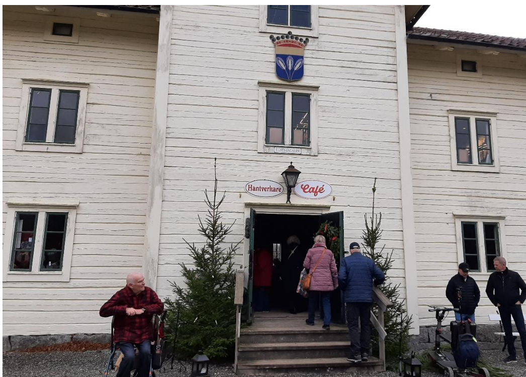
I en annan byggnad samsades flera utställare i två plan med en servering, så här fanns också möjlighet att få något i magen.