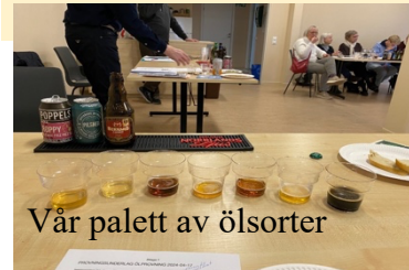
Vår palett av ölsorter

Vi fick lära oss mycket om malt, humle, jäsning och bryggningsteknik och hur det i rätt sammansättning kan förvandlas till välsmakande öl.