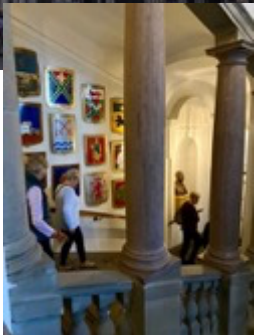
Trappor, trappor, trappor