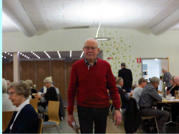
Två glada vinnare till. Efter lotteriet var vi tvungna att ägna oss åt föreningens olika aktiviteter.