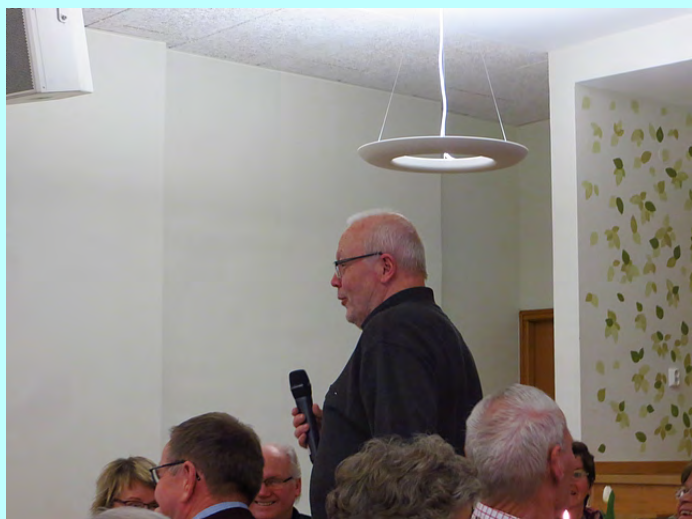
Nya medlemmar presenterar sig.