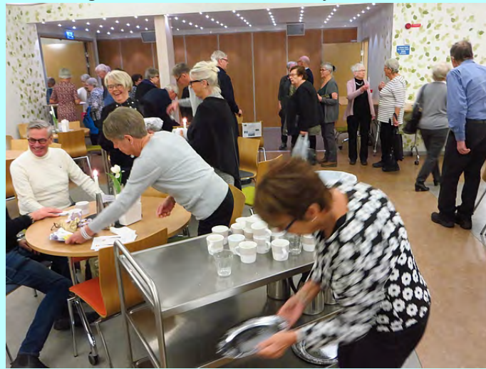
STORT tack till serveringsvärdarna.