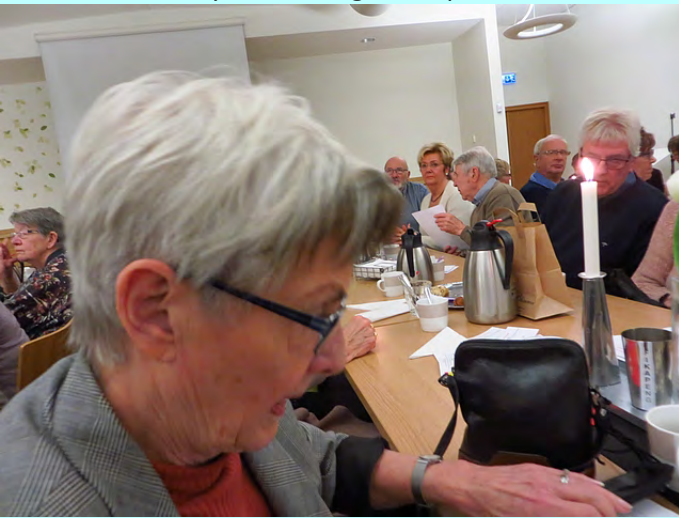
Vinnare på entrébiljetten.