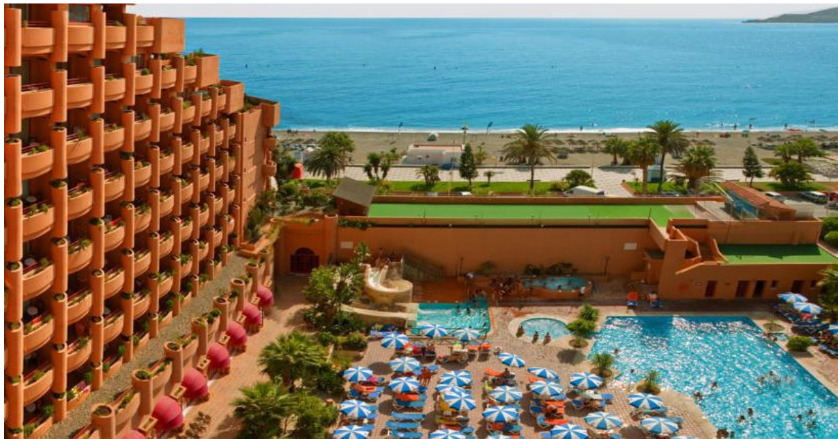
Vårt fina hotell Ibersol Almuñecar Beach & SPA