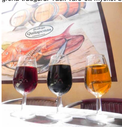
Olika viner från Bodega Quita Pena