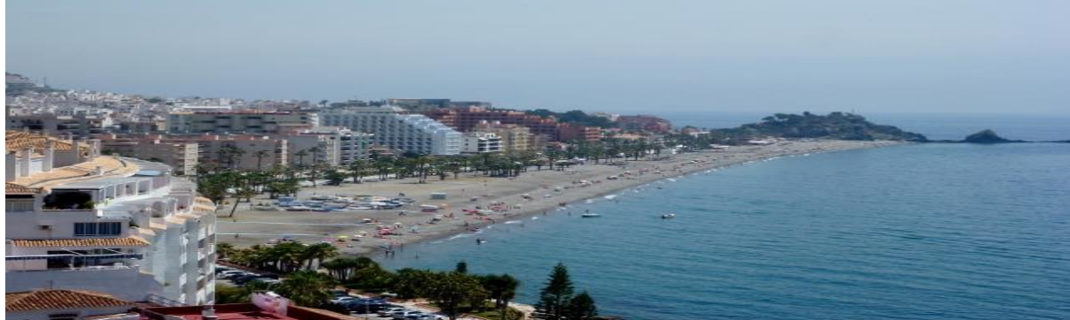
Stranden i Almuñecar