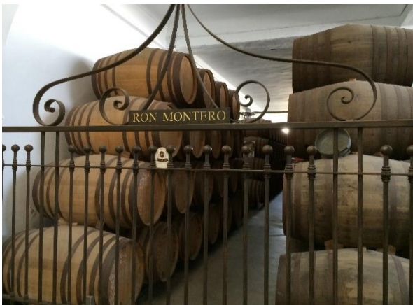
Romfabriken Ron Montero