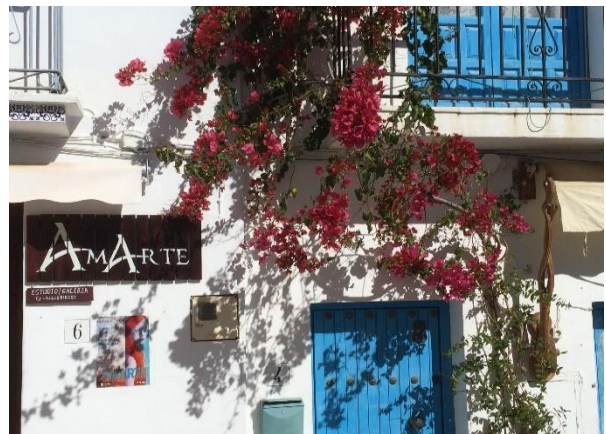
Från Frigliana – Spaniens vackraste by