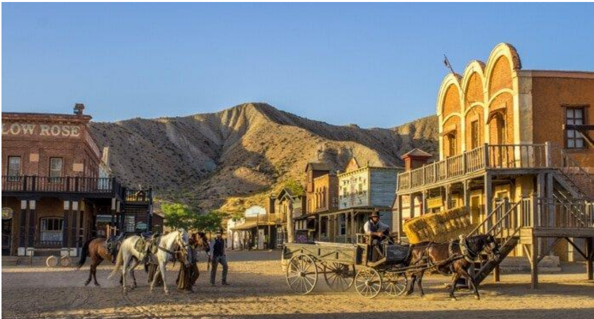
Vilda Västern – Mini Hollywood utanför Almeria

Välkommen till vinterns trevligaste flygresor!