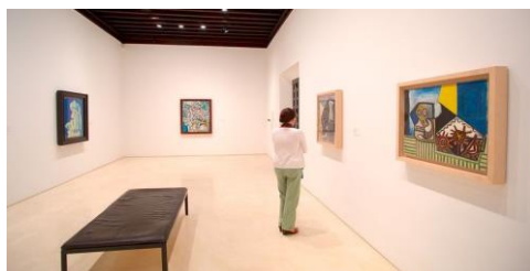
Picassomuséet i Málaga