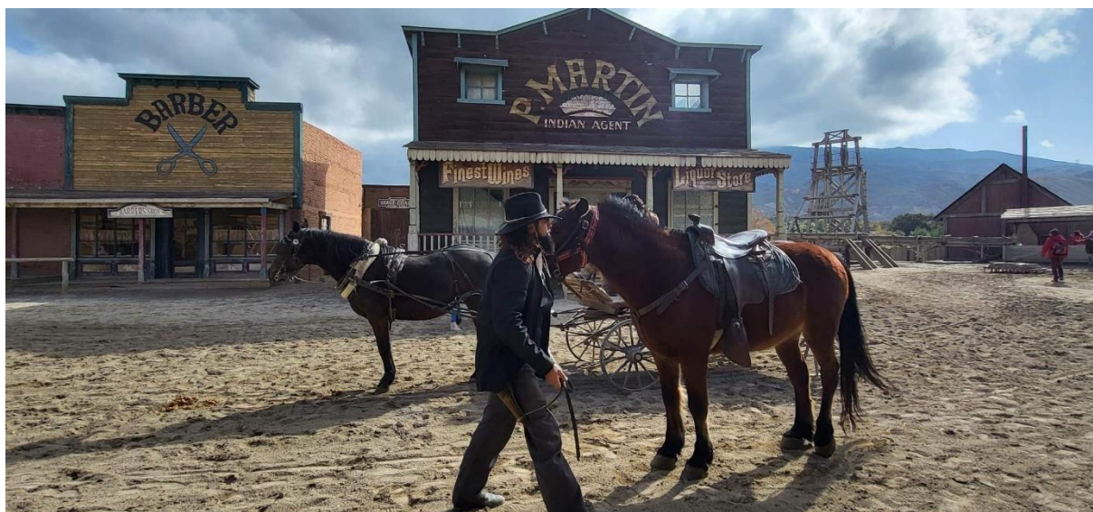
Oasys Mini Hollywood Theme Park, Desierto de Tabernas

Vi beger oss 16 mil öster ut mot Almeria till det ökenliknande området Desierto de Tabernas, även kallat för Europas egna Hollywood! Resan dit blir annorlunda och intressant med ett kontrastrikt landskap. Det var i detta karga och dramatiska landskap som filmhistoria skrevs under 60- och 70-talet. Med välkända vilda västernfilmer som "För en handfull dollar", "För några dollar mer" och "Den gode, den onde, den fule" med Clint Eastwood i huvudrollerna fick Desierto de Tabernas internationellt uppsving. Bland dessa canyons och raviner får man känslan av att Clint eller Charles Bronson kan dyka upp vid nästa krök. Vi får uppleva denna unika temapark med sina tre filmbyar och spännande uppträdanden som utspelas på stadens torg. Det blir även countrymusik och livlig Cancanshow i saloonen. Vi tar del av den vackra kaktusparken och parkens egna zoo. Efter en välsmakande lunchbuffé vänder vi tillbaka till Almuñecar.