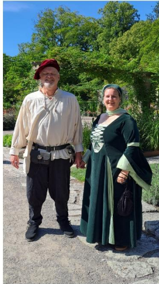
23 medlemmar deltog i kryssningen till Medeltidsveckan i Visby