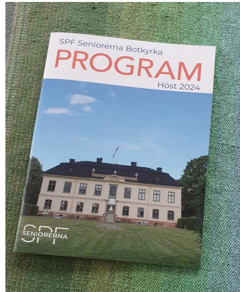
På måndag postas höstprogrammet till er alla. Något att se fram emot!