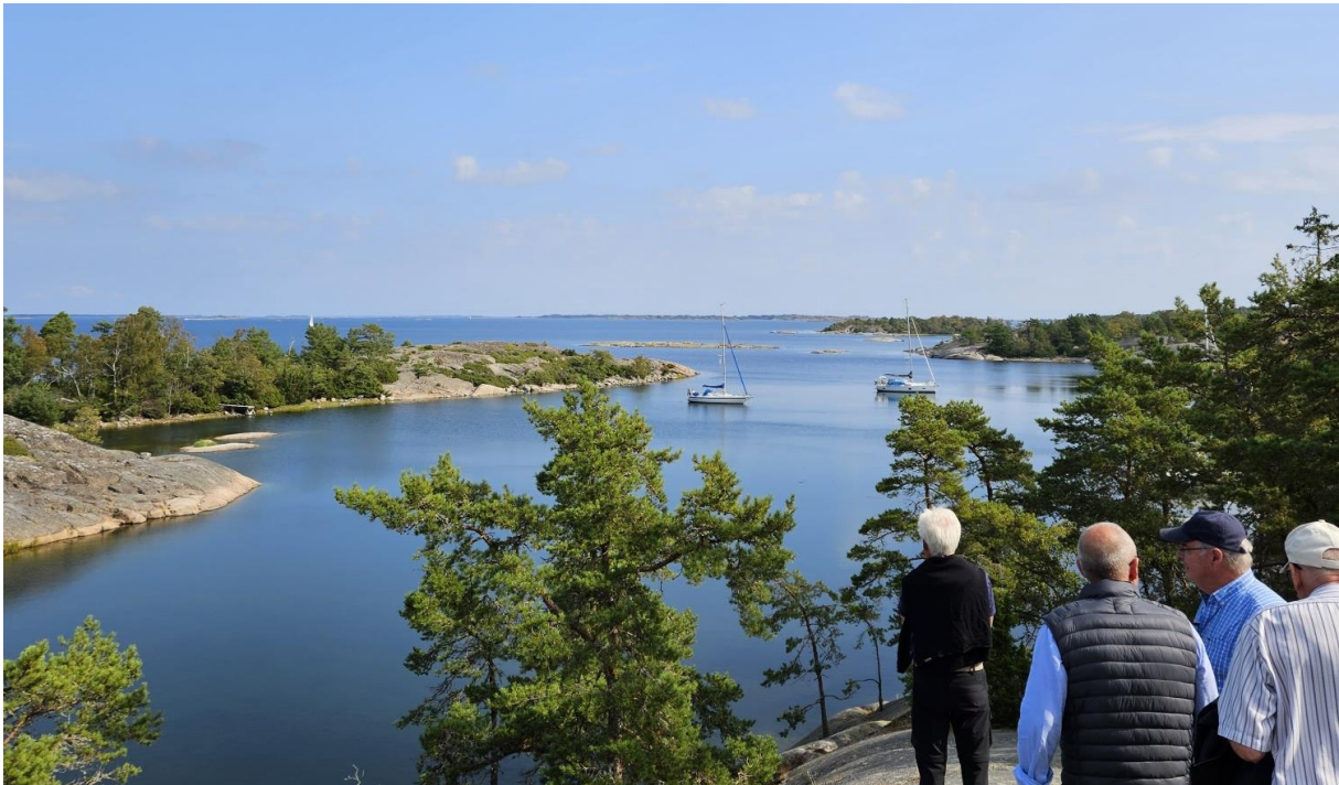
Båtturen till Biskopsö och Tärnskär i yttersta havsbandet blev en storslagen naturupplevelse

OBS att plusgironumret för surströmmingsfesten blev fel i förra veckobrevet, rätt nummer finns nedan.