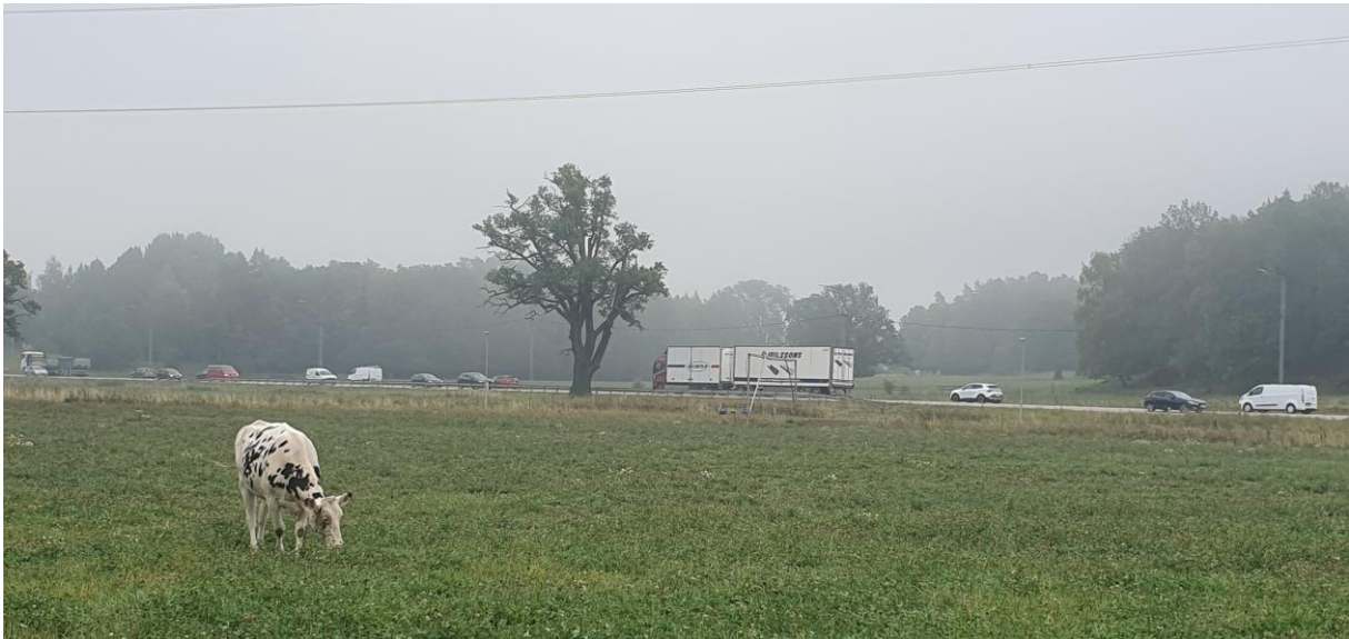
Morgondimma över Hågelbyleden den 30 augusti