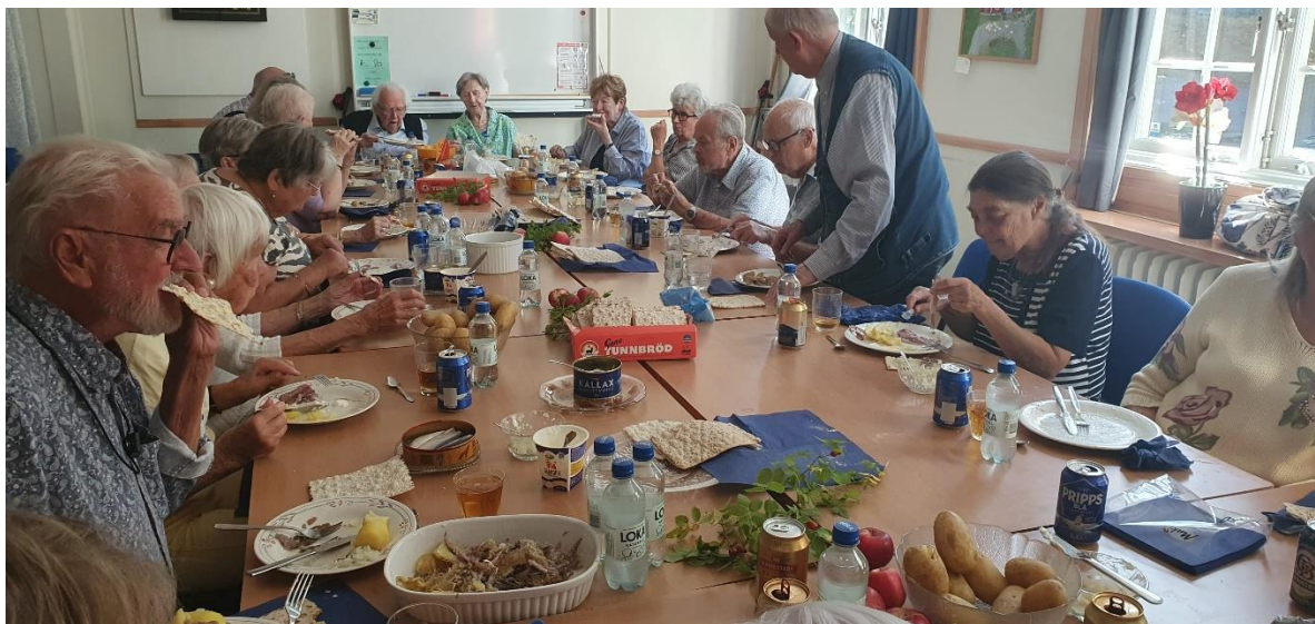
Surströmmingsfesten blev, förutom en kulinarisk upplevelse, en glad tillställning