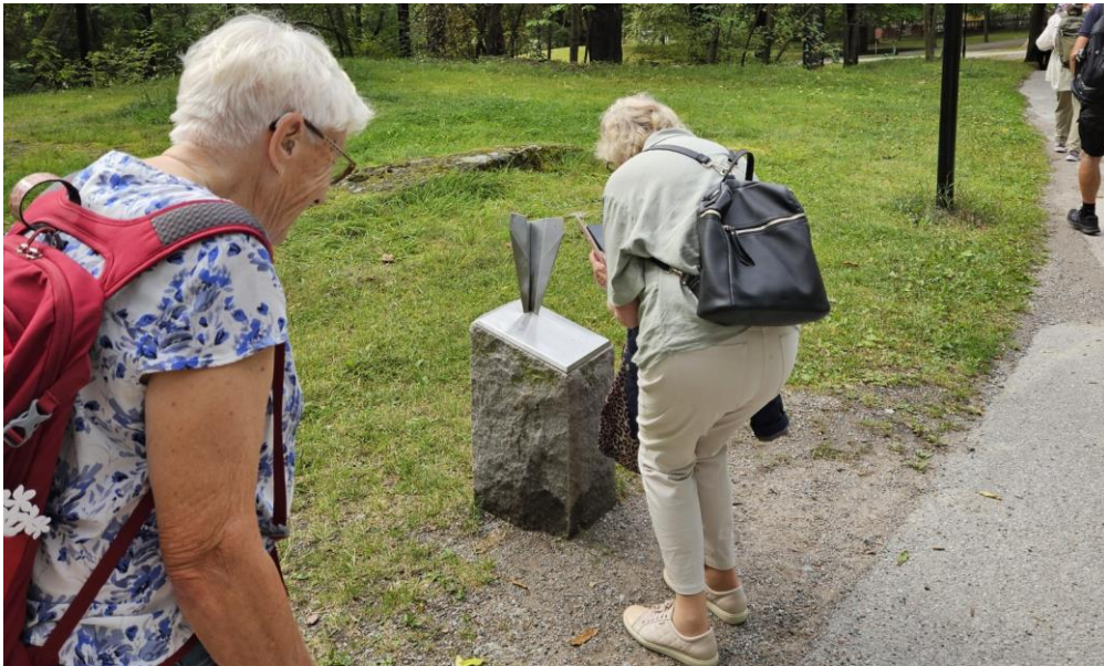
Från onsdagens vandring: Vid vattenfestivalen 1993 kraschade ett vigenplan på Långholmen i samband med en uppvisning. Platsen har markerats med ett mycket diskret minnesmärke, inte helt lätt att hitta.