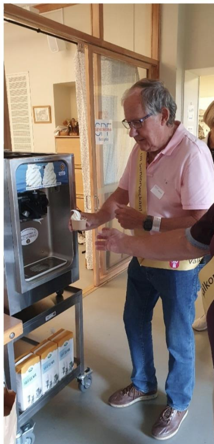
Ny uppgift för styrelseledamöter: Att servera mjukglass till besökarna

Seniorveckan som kommunen och de ideella föreningarna anordnar varje år var även i år innehållsrik och välbesökt. Seniorhuset hade Öppet hus, där PRO grillade korv och SPF bjöd på kaffe och mjukglass. Våra glassgubbar fixade över 100 portioner utan större missöden.