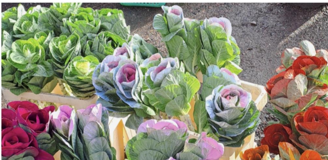
Potatis på grillspett och grönsaker som blommor – från förra veckans resa till Öland

Rapport från ett seminarium om hälsa , anordnat av Stockholmsdistriktet, där vi fick lyssna till föreläsningar av experter från Folkhälsomyndigheten.