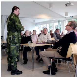
Träffpunkt SPF Ale