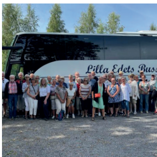
Resor och kultur