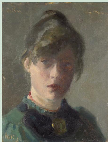
Marie Krøyer - Självporträtt 1889