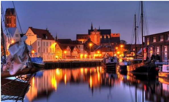
Hotel New Orleans ligger centralt vid hamnen

Samling på pendelparkeringen Pinan på Hönö kl. 07.30, dit vår moderna buss från Leja Touring har anlänt. Vi tar färjan kl. 07.50 över till Lilla Varholmen medan resenärer från Björkö tar färjan kl. 08.00 över till Lilla Varholmen. Här strålar vi samman och börjar vår resa söderut. Vi hämtar upp eventuella resenärer även i Västra Frölunda innan vi fortsätter vår första etapp till Rasta Hallandsåsen där det serveras kaffe och fralla. Sedan fortsätter vi vidare söderut via Öresundsbron till Rödby och färjan till Puttgarden. Färjan tar 45 minuter och vi får tid att såväl äta lunch på egen hand samt shoppa lite i butikerna ombord. Vi åker nu direkt ut på de tyska motorvägarna österut mot Wismar. Vid 18.00-tiden checkar vi in på fina Hotel New Orleans i centrum nära hamnen med promenadavstånd till julmarknaden och alla varuhus. Kl. 19.30 serveras gemensam middag i hotellets trevliga restaurang.