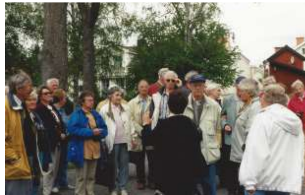
Utflykt St Annas_2002