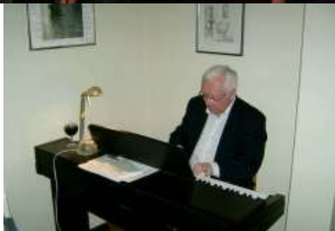
Skön musik framfördes vid PUB-76 afton