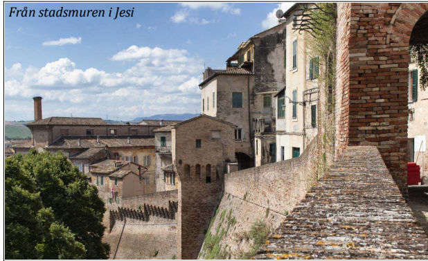
Från stadsmuren i Jesi