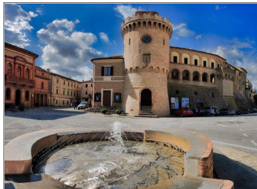
Under besöket i Montecarotto skall vi bekanta oss med klocktornet och teatern.