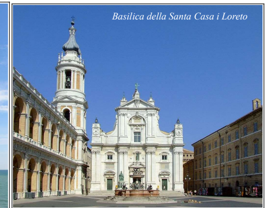
Basilica della Santa Casa i Loreto

över berget Monte Conero fram till staden Sirolo och en fisk- och skaldjurslunch.