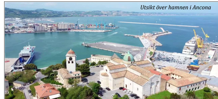
Utsikt över hamnen i Ancona