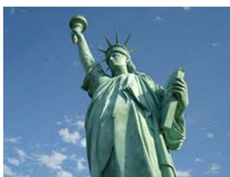
Frihetsgudinnan skapad i Colmar

Vi fortsätter till lilla byn Ammerswihr där vinprovning väntar. På alla vingårdarna finns det givetvis möjlighet att handla. Nu går färden till Sigolsheim med fin utsikt över området. Här gör vi ett besök vid den allierade krigs kyrkogården. Frontlinjen i början av 1945 gick runt Colmar. I pittoreska Riquewihr äter vi en riktig Alsace lunch på en av byns trevliga restauranger, och vi kan se oss om i byn, beundra husen och blommorna, kanske besöka någon vinbutik, köpa gåslever eller ta en fika. Sista punkt är en vinprovning i Kientzheim. Gemensam middag på kvällen. Vinprovningarna är noggrant utvalda med hänsyn till vinets kvalitet. (F, L, M)