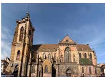
Katedralen i Colmar