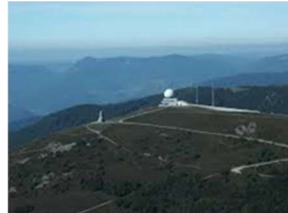
Ballon d'Alsace 1171m