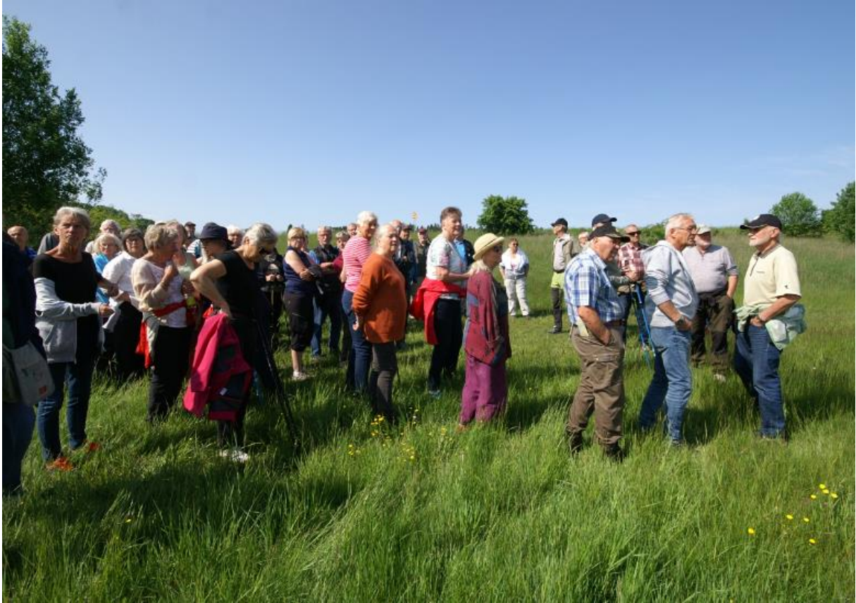
Här väntar vi in kön och får en paus.