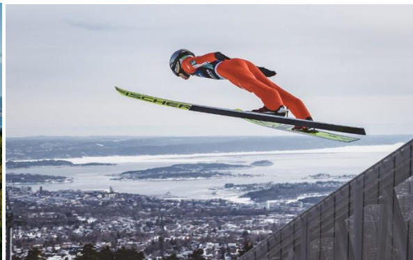
Holmenkollen utanför Oslo