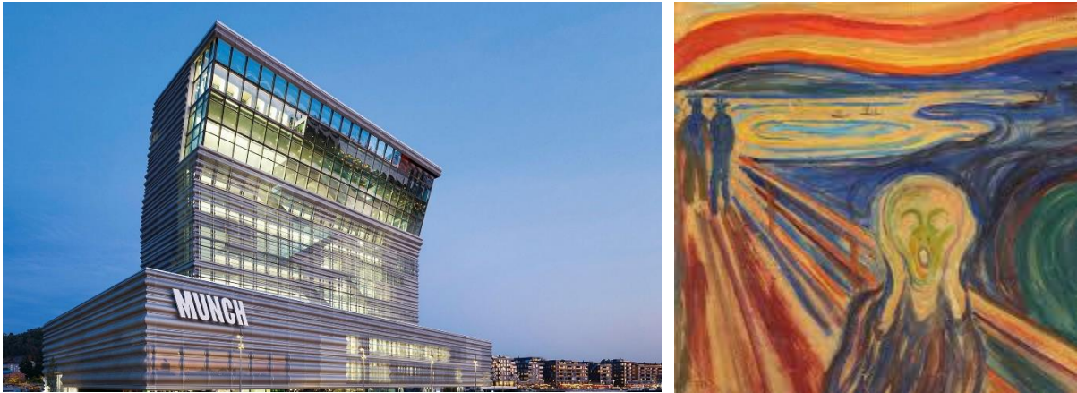
Munch Konstmuseum med den berömda målningen "Skriet"

konst till kommunen i 1940, fyra år innan han dog, 1100 målningar, 15000 grafiska blad och över 2000 böcker. Efter detta intressanta besök fortsätter vi till Bygdøy och Kon-Tiki-Museet. Det är ett museum över Kon-Tiki-expeditionen (1947) och över andra expeditioner som leddes av Thor Heyerdahl: Ra I (1969), Ra II (1970) och Tigris (1977). Museet innehåller också föremål som Thor Heyerdahl samlat vid sina arkeologiska utgrävningar på Påskön, en kopia av en av öns basaltstatyer och en kopia av en relief av mytiska fågelmän, som Heyerdahls grupp fann vid utgrävningar i Tucume i nordvästra Peru. Här finns även en kafeteria för en lättare lunch eller fika. Vi fortsätter till Holmenkollen som ligger