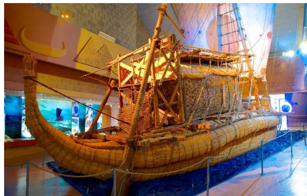
Flottar från Thor Heyerdahls upptäcktsfärder

en mil utanför Oslo, ett känt skidcenter vintertid. Här kan man ta sig upp i hoppornet för magnifik utsikt eller bara promenera vid skidcentret där Anders Södergren en gång välkomnades av 50 000 norrmän när han vann femmilen 2006 och 2008. Den gamla hoppbacken är numera ersatt av en ny och större hoppbacke, som togs i bruk till Skid-VM i Oslo 2011. Efter detta besök med fantastisk utsikt över staden, tar vi fatt på hemresan mot Göteborg. Vi kör E6:an hela vägen, över Svinesundsbron och till Rasta Håby. Här serveras resans sista middag och vi beräknar att komma tillbaka till Göteborg runt kl. 20.30, och därefter till Frölunda en kvart senare.