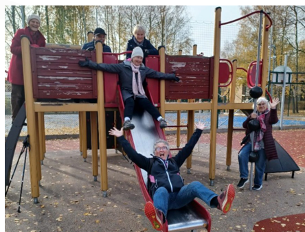
Ett snabbt "lekstopp" under promenaden.

Mer specifik information kommer att skickas ut via mejl i god tid före resan.