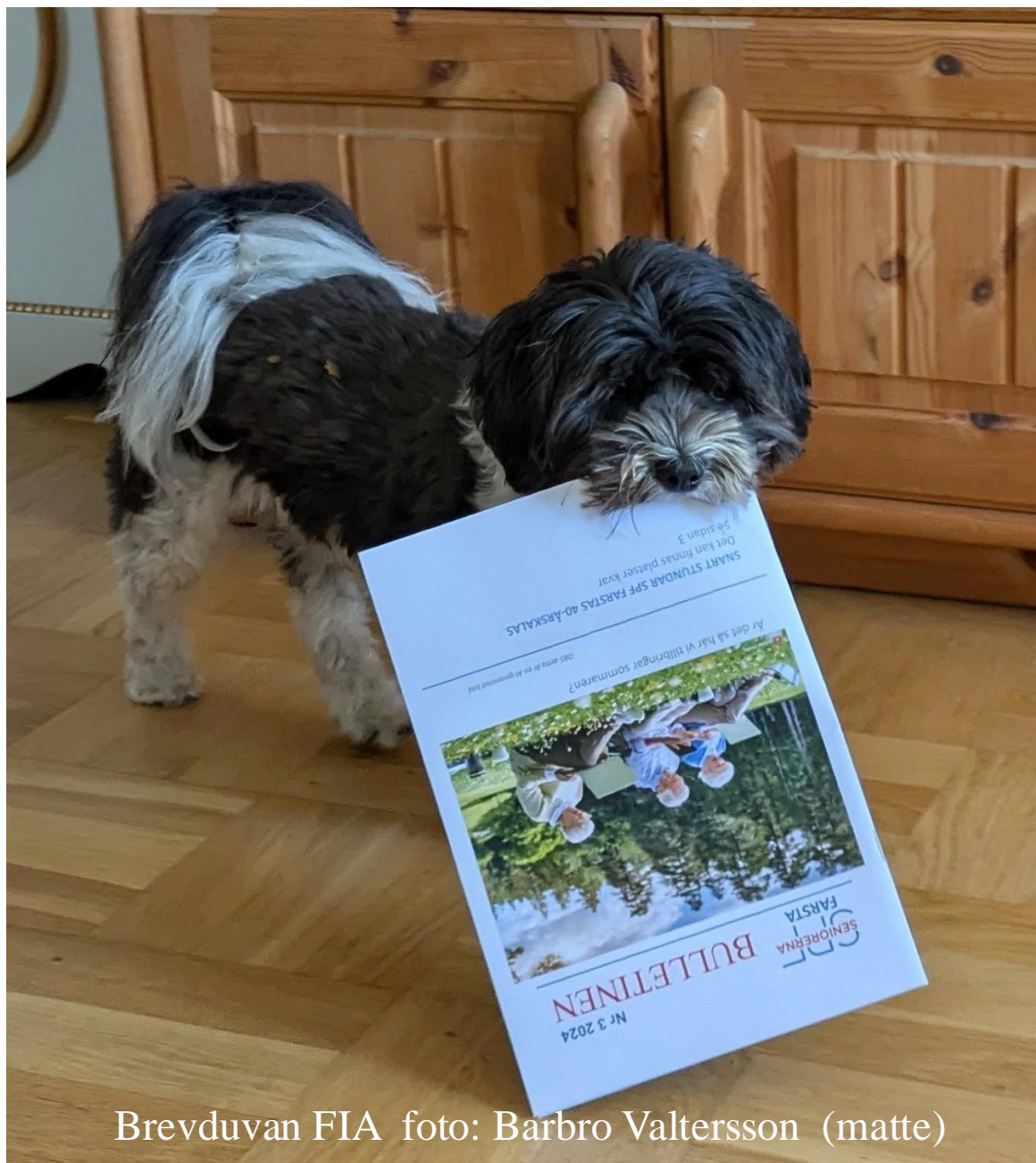
Brevduvan FIA foto: Barbro Valtersson (matte)

För att kunna hålla en hög kvalitet i allt vad vår styrelse gör behövs alltid hjälpande händer. Utan engagemang ingen förening. Är du beredd att hjälpa till?