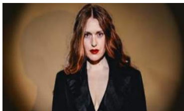
Fotograf: Caroline Franzén Maja Gallstad

Precis som pjäsen, råkade operan ut för censur och hård kritik från kyrkan. På Wiens opera fick den inte spelas alls och på Metropolitan stängdes den ner efter bara en föreställning. Idag är operan en klassiker.