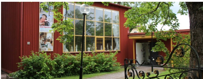
Bror Hjorts hus

Bussen hämtar upp på respektive hållplats.