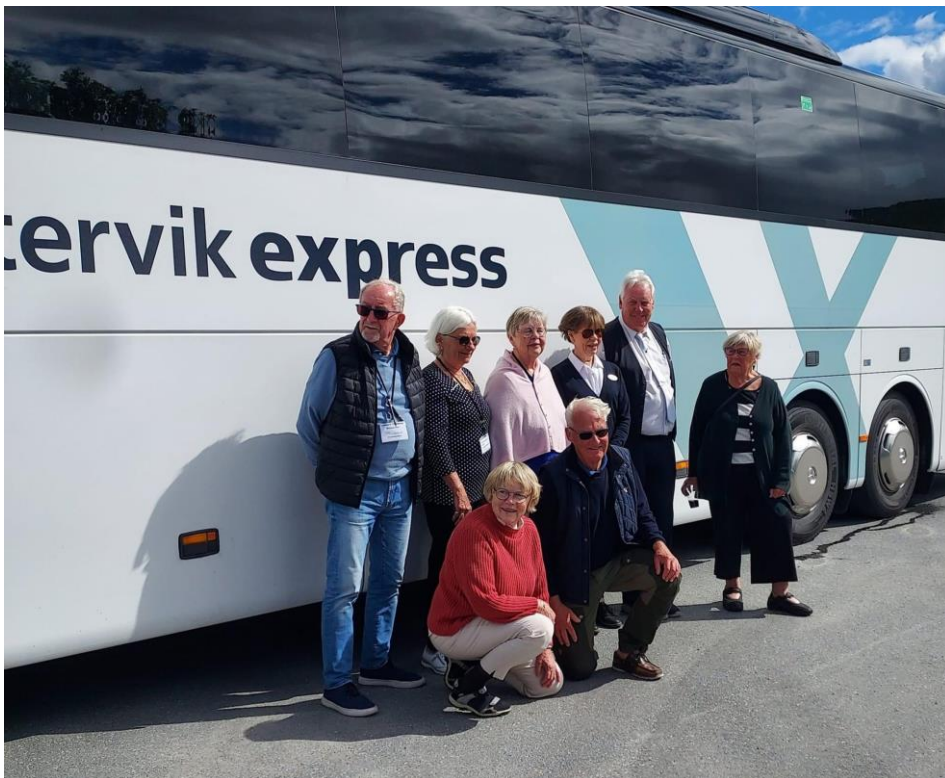
gjort denna resa!