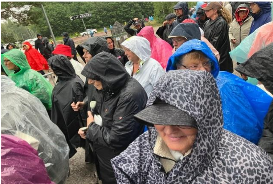
Glada miner trots regnet