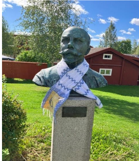
Dag 2 gick färden vidare till Sundborn och Carl Larsson-gården