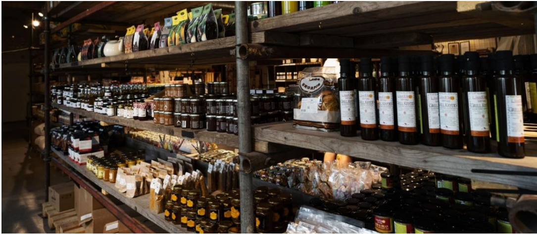
Shopping i bodarna på Stora Skedvi Bröd