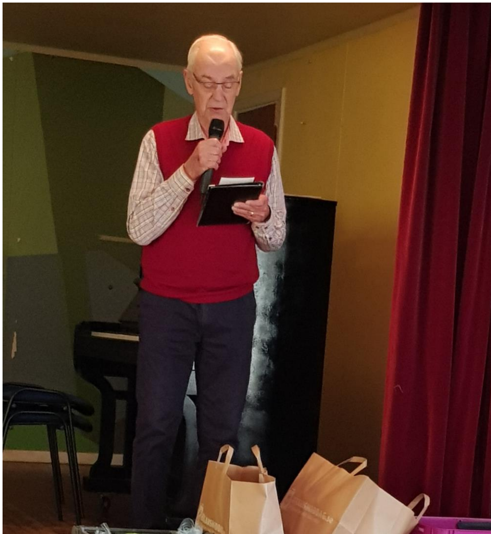
KEA hälsar välkomna med diktläsning