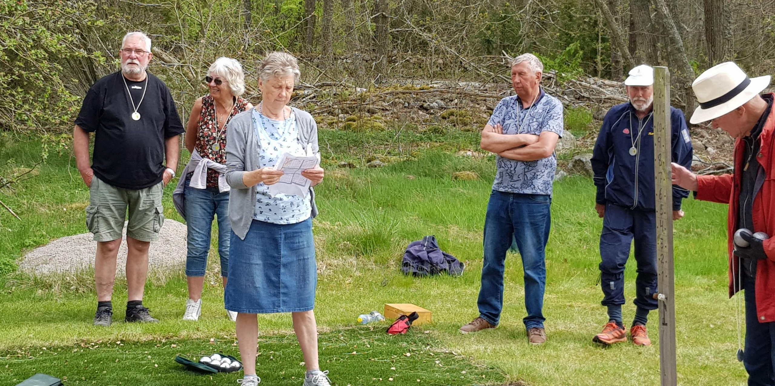
Maggan presenterar dagens aktiviteter Boule, Tipsrunda utställning av tovade fåglar