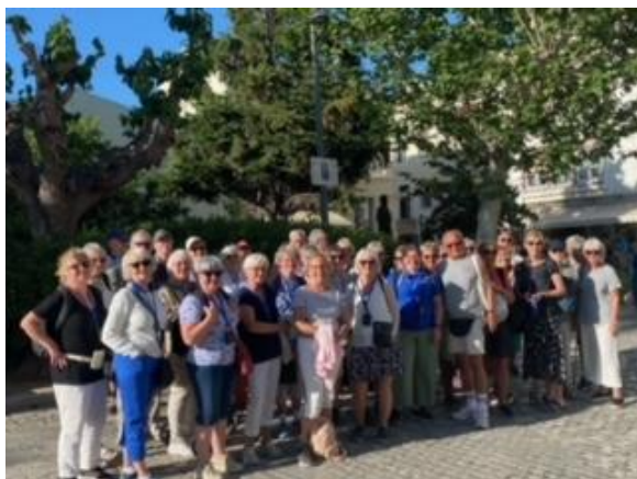
Resa till Grekland