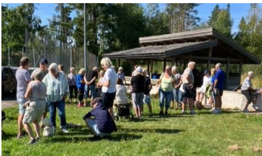
Upptaktsmöte i Tingta