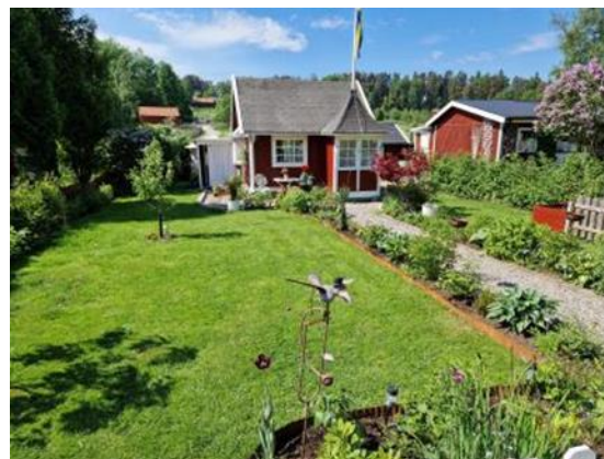
Promenad i Vallby koloniområde