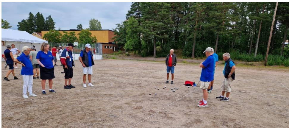
Aros boulelag i SPF DM