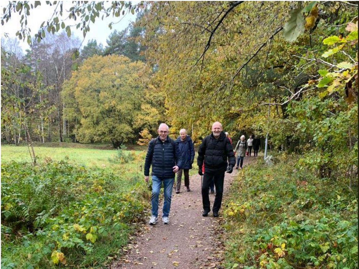
Vandring i Backa