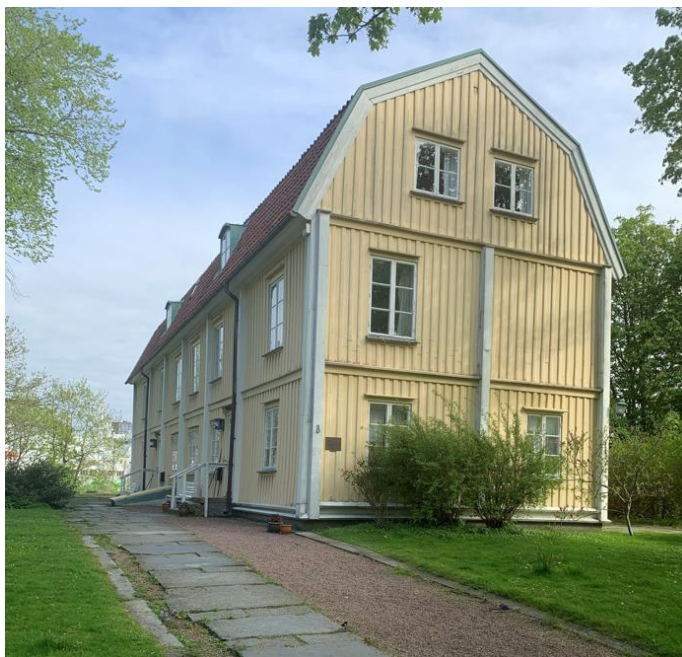
Taubehuset (SPF;s Kansli)