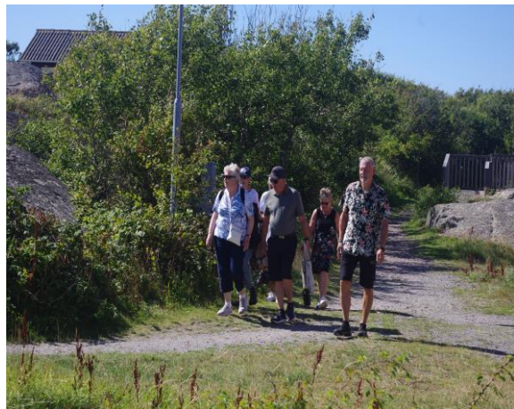
Resa till Vinga