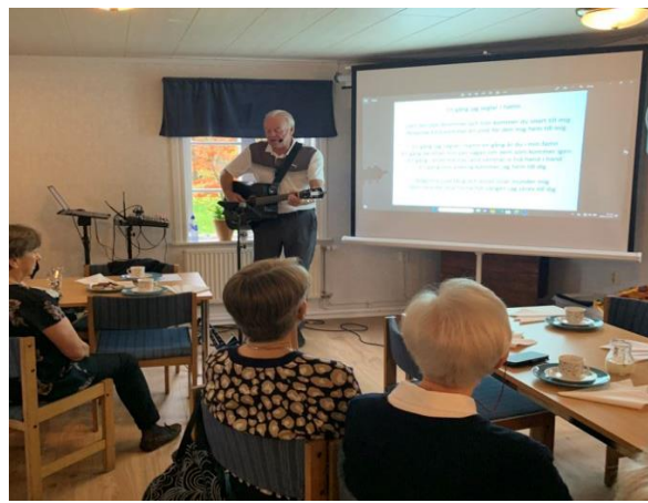
Månadsmöte med Pecke polis