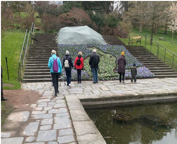
Vandring Botaniska trädgården