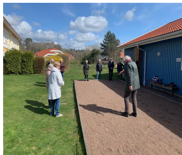
Boule på Plockerotegatan