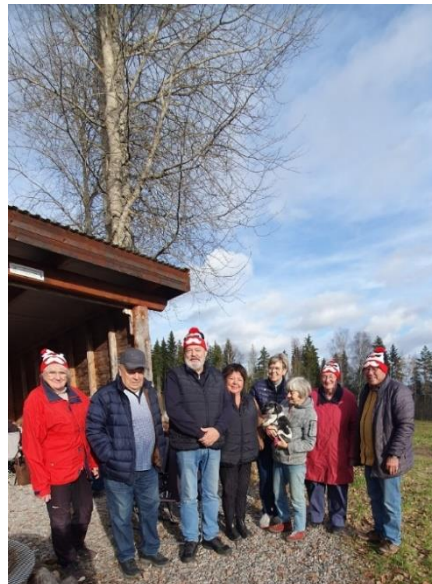
De två "ettorna"