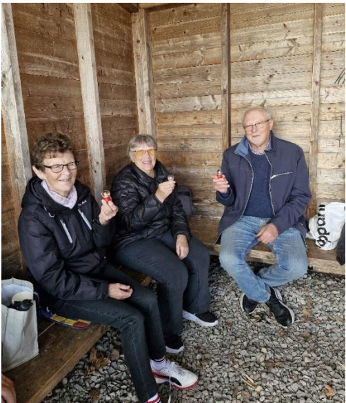
Glada tredje pristagare