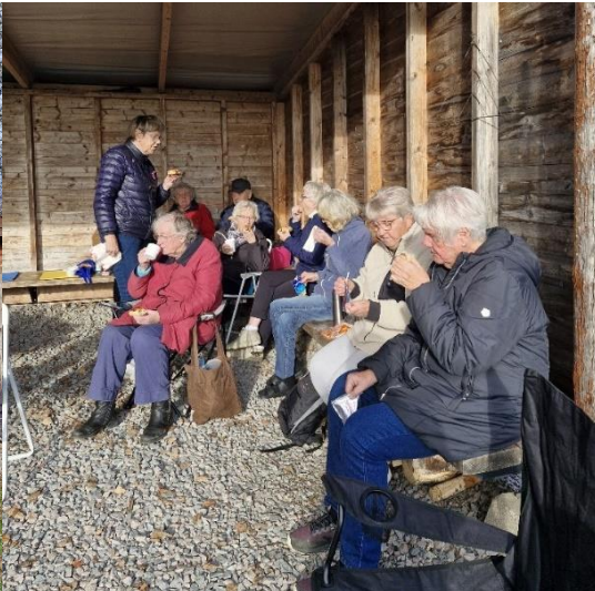
Efter fullgjort tävlande!