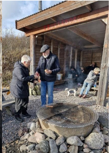
Vill Du ha senap?