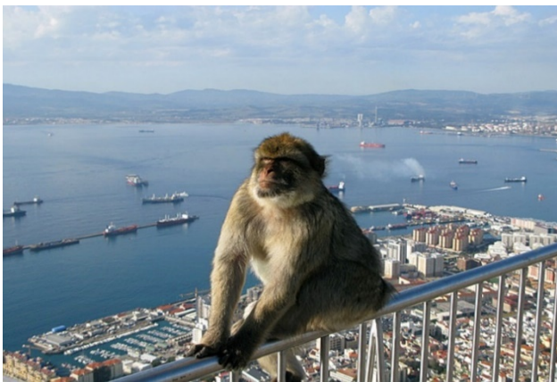
Gibraltars berömda apor

Vi åker med bussen längs solkusten till Gibraltar som är en brittisk enklav på det spanska fastlandet. Här möts vi av minibussar som tar oss med på en rundtur runt Gibraltarhalvön. Vi stannar självklart till vid utsiktspunkten Europa Point där man vid vackert väder kan se över till Marocko. Vid droppstensgrottan St. Michaels grotta får vi chans att träffa makakaporna som bor på Giblartarklippan. Gibraltar är inte längre medlem i EU och här handlar man taxfree vilket gör att köp av alkohol, tobak, kläder, parfym, smycken etc. blir mycket prisvärt. Vi får därför god tid till lunch och shopping på egen hand innan vi beger oss hemåt igen till Benalmádena. Pass är ett måste att ta med sig på denna utflykt! (Det tar knappt två timmar med bussen till Gibraltar och det gör att vi kan få god tid i Gibraltar)