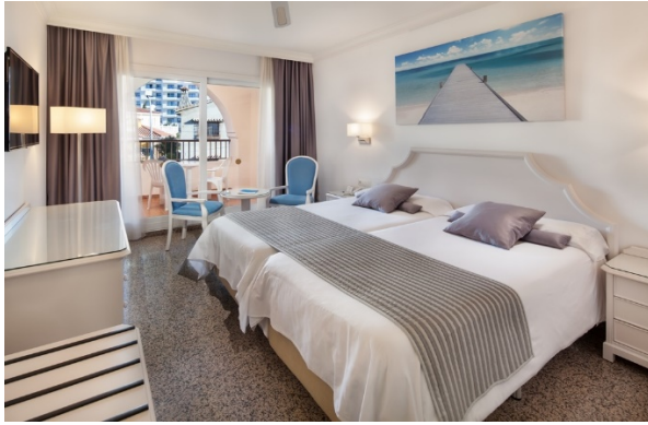
Vårt fina hotell