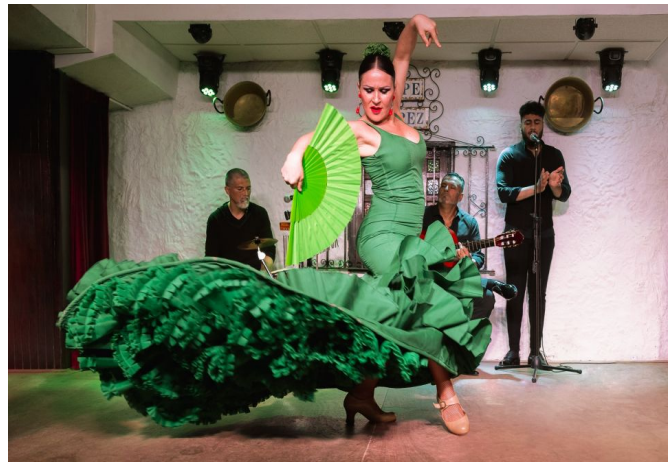
Flamenco Show finns i Benalmádena

Välkommen till vinterns trevliga må-bra-resa!