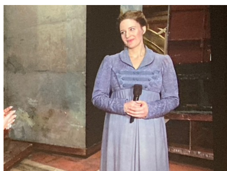
Floria Tosca, sopranen Lise Davidsen