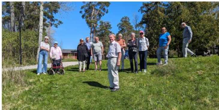
Funktionärs- & Brevduveresan den 13 maj