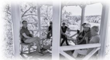
Bild från en av vårens onsdagspromenader - vi pustar ut i lusthuset ovan- för Edssjön den 22 maj