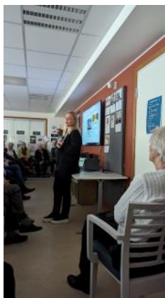
Bostäder för äldre den 17 april