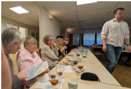
Vinprovningen den 22 april