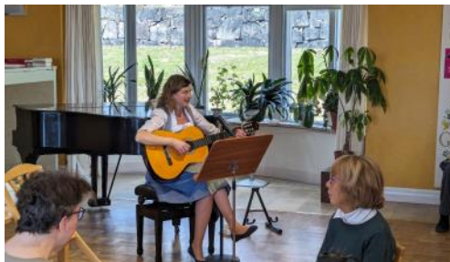
Månadsmötet den 8 april