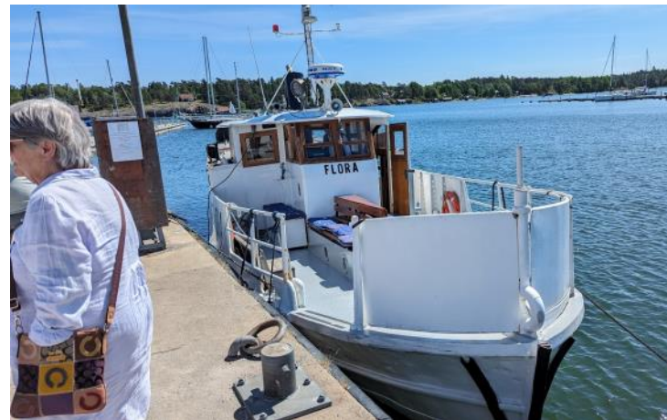
Resan till Nynäshamn den 4 & 12 juni

Vi tackar våra annonsörer samt Percys kött och ICA Norrviken för att de stödjer vår verksamhet för äldre i Sollentuna, ett stort tack till er alla ❤️