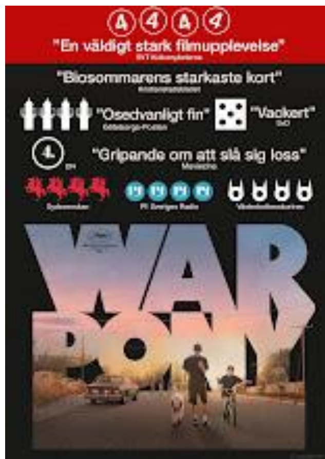
Dålig bildkvalitet på originalbild