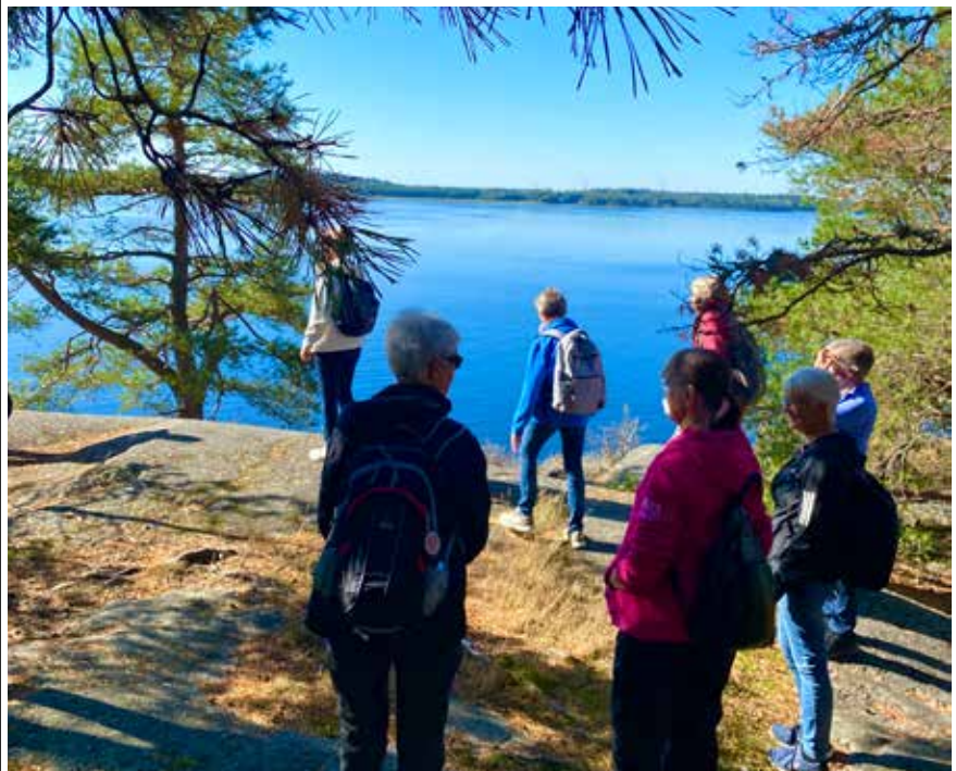
Omslagsbilden: Vandring i Frölunda friluftsområde