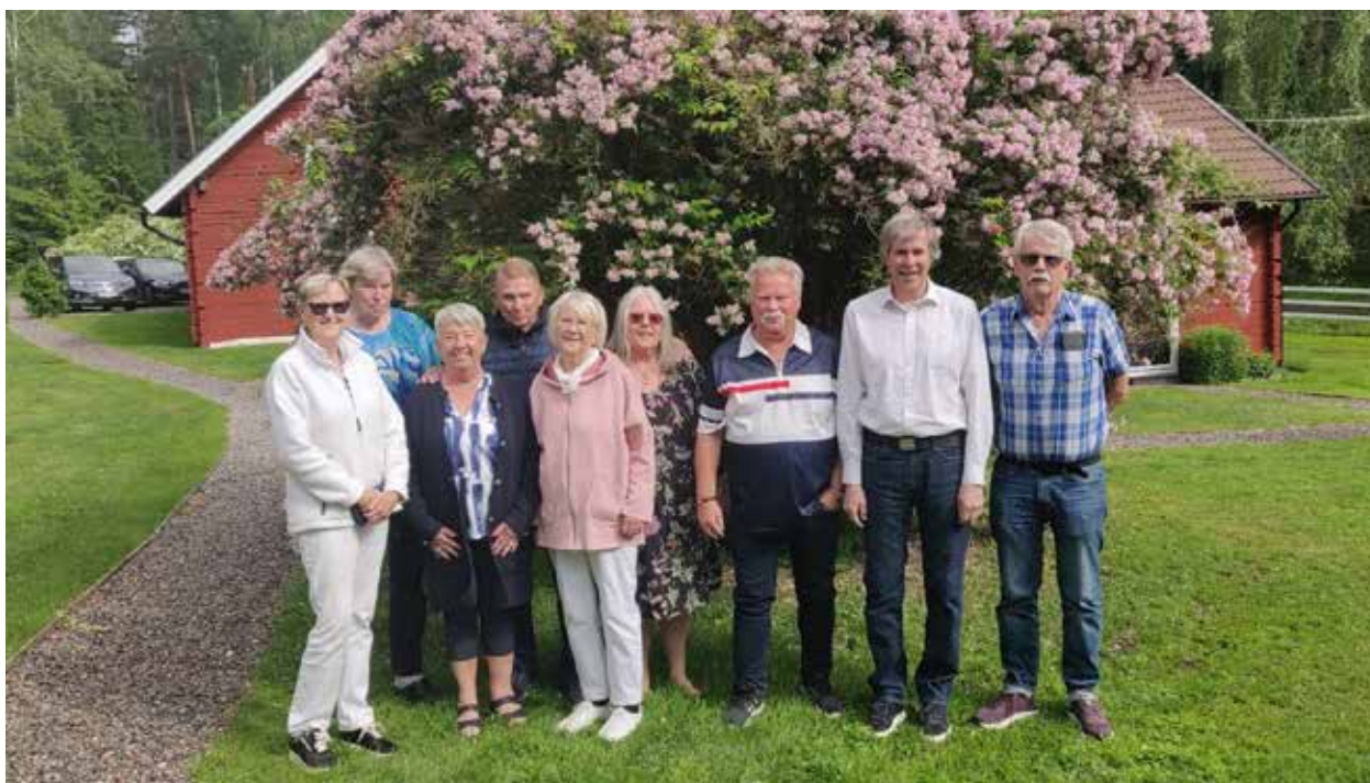
Styrelsen för SPF Håbo

I nvigningen av vår nya park bakom Skeppsgården blev en succé med massor av deltagare, och invignings- talare av våra kommunalråd, som till