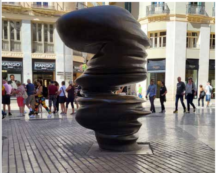
Omslagsbilden: Staty i Malaga