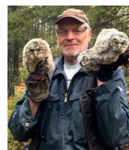
Ringmärkningen är slutförd

Onsdag 21 maj promenad Elfviklandet, Lidingö