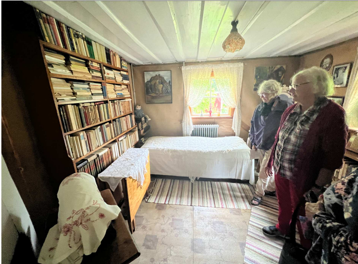
Detta är Moas sovrum. Sängen var allt annat än dagens mått. Längd och bredd var inte mycket att hurra för.