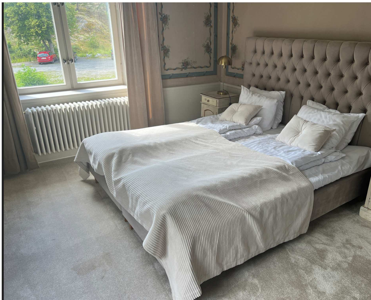
Samma rum från en annan vinkel.