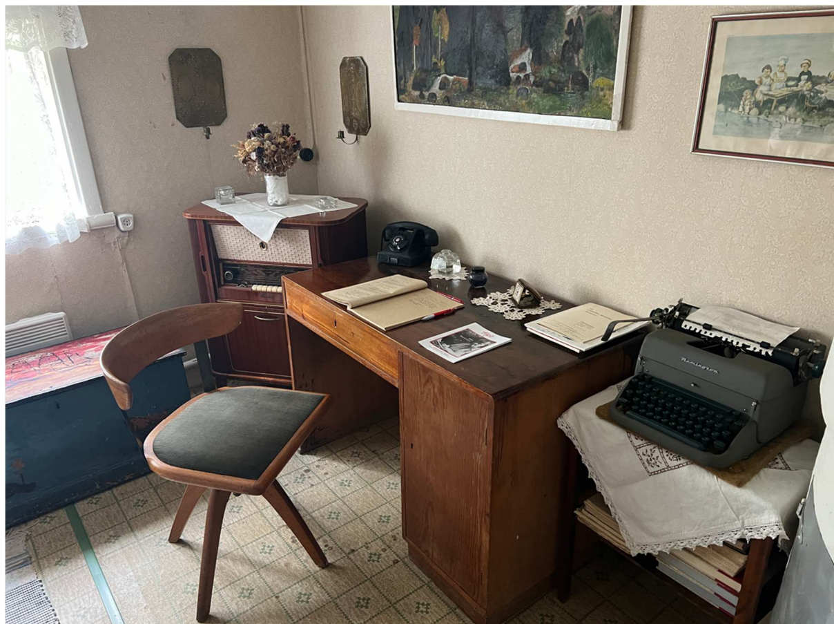
Arbetsrummet från en annan vinkel.