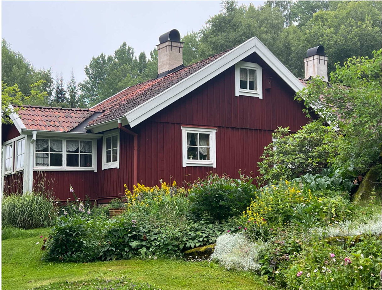
Torpet ligger i en mycket naturskön miljö.