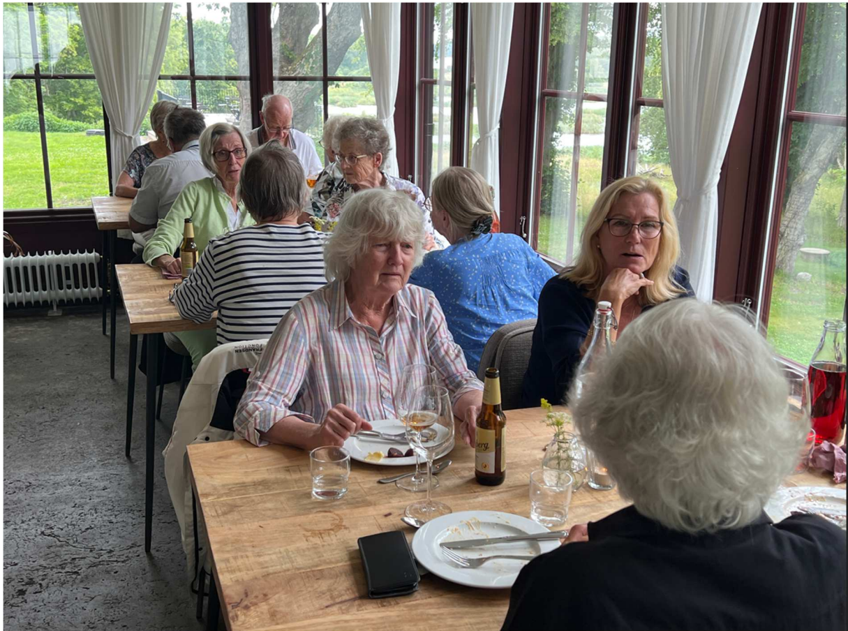
Här några som för mig är både nya och gamla bekanskap.