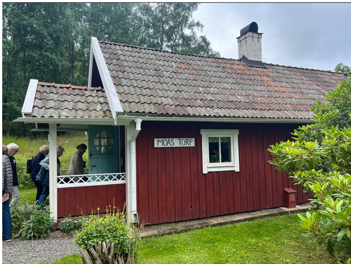
På väg in i stugan.