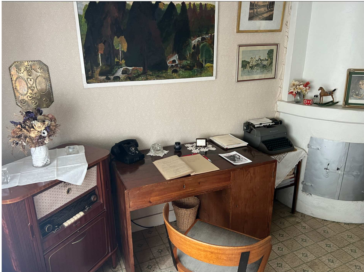
Moas arbetsrum med skrivbordet och en gammal Remington skrivmaskin. Radion till vänster är en s.k. radiogrammofon som var vanlig i hemmen en gång i tiden.