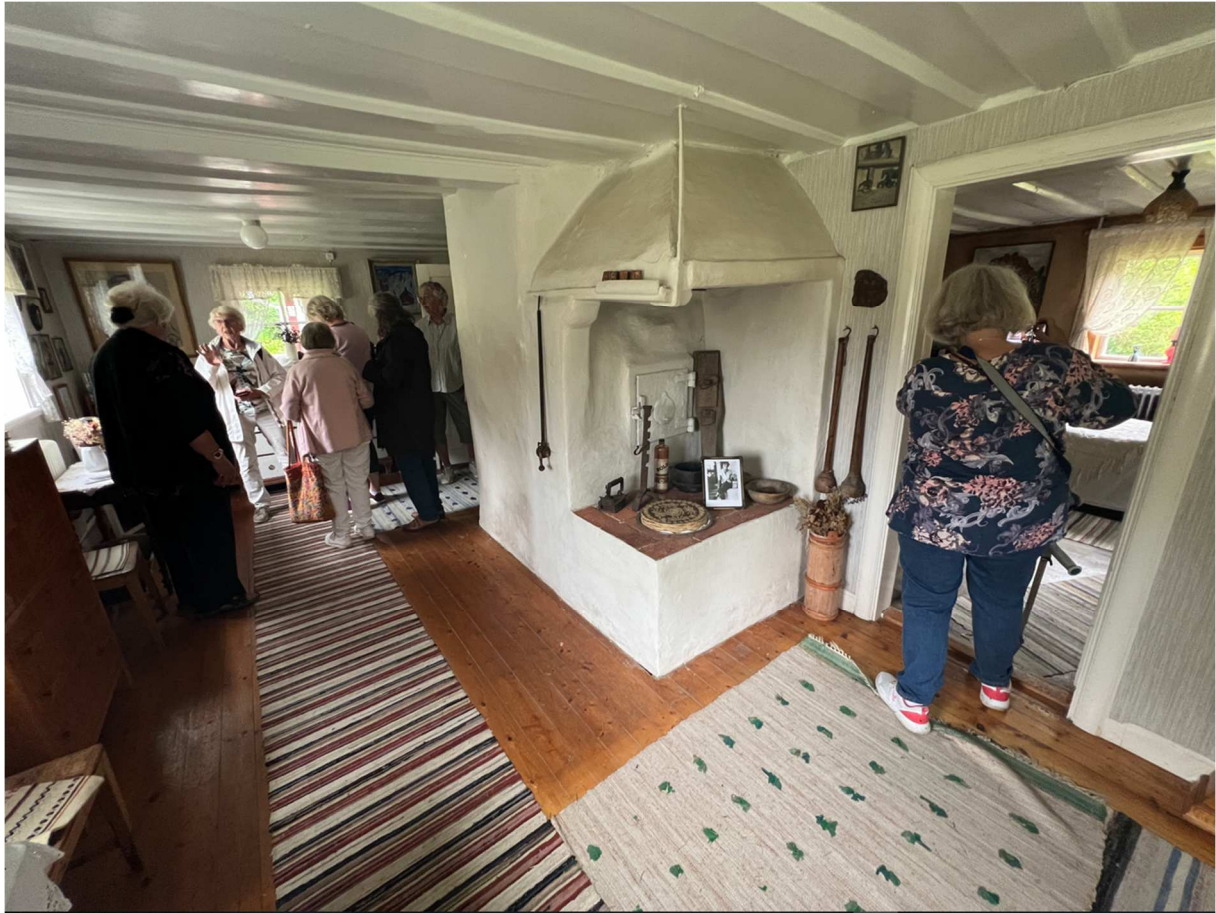
Gamla köket med spisen som man lagade mat i och fick värme till huset.