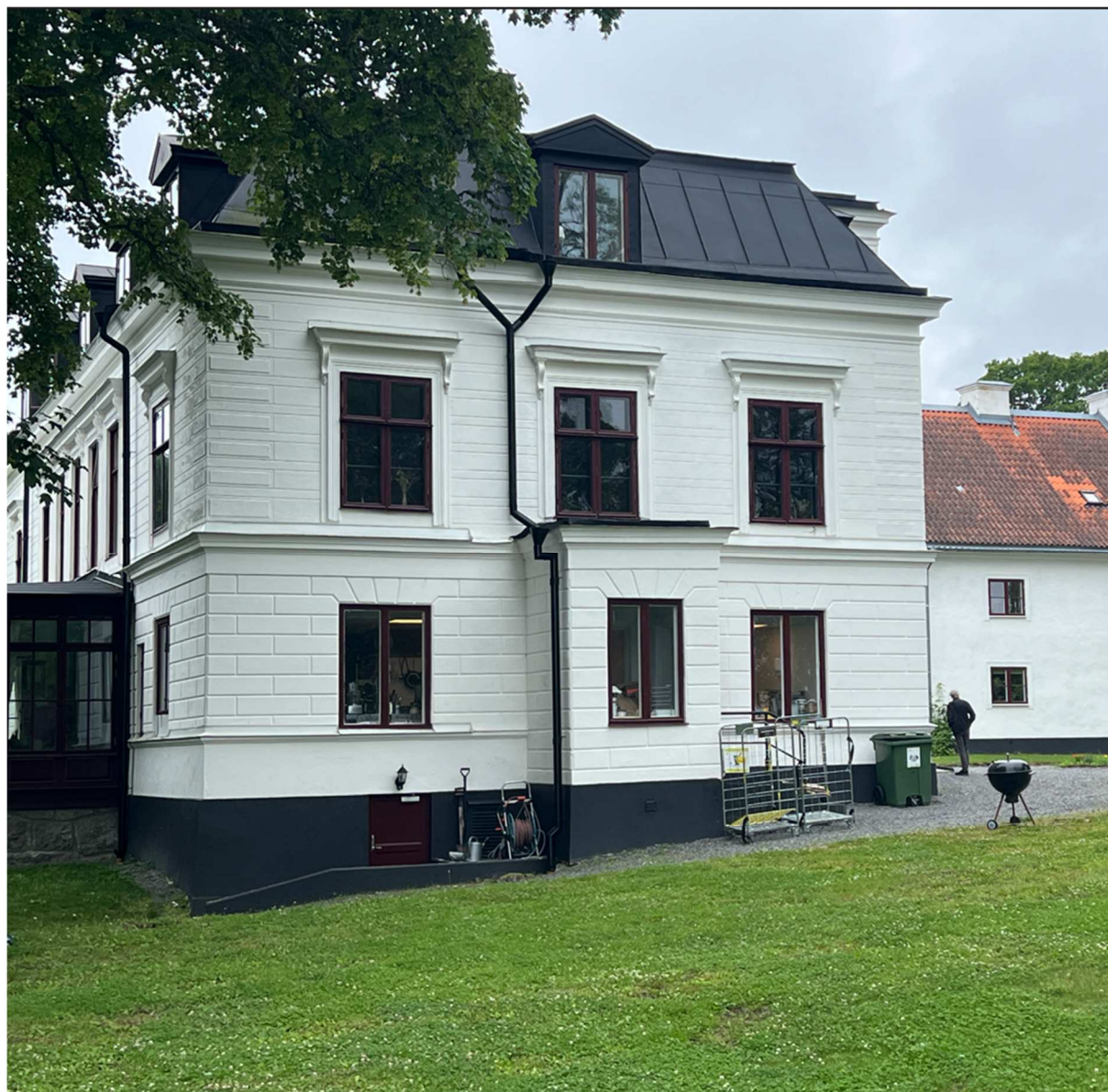
Gården från gavelsidan.