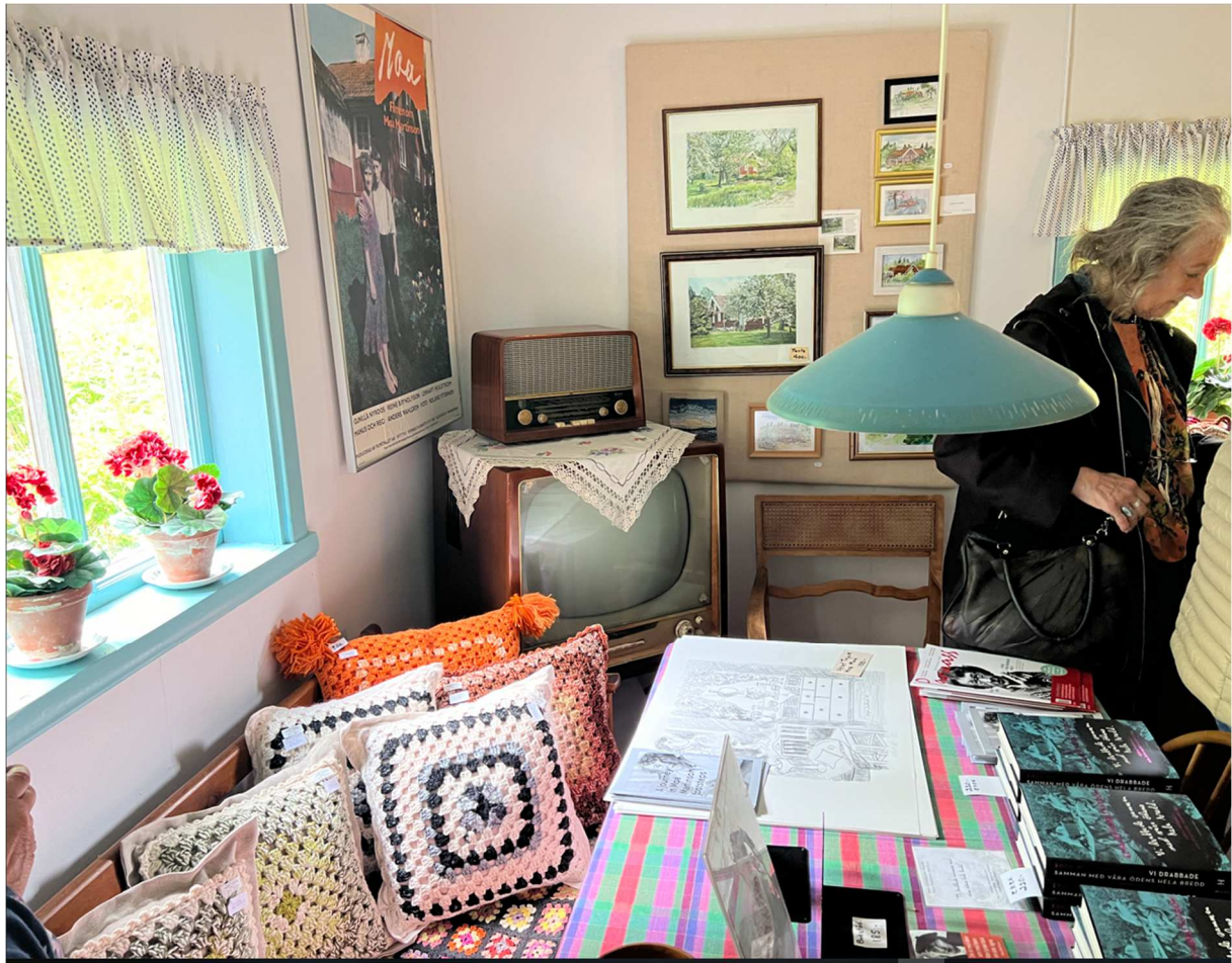
Ett av rummen där det faktiskt fanns en tv som troligtvis var från sent 50-tal eller tidigt 60-tal.