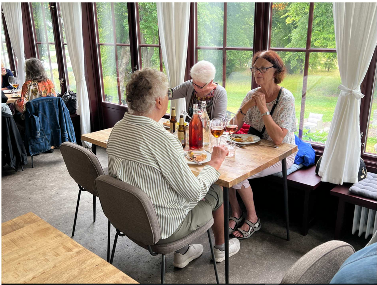
Ytterligare några som gärna följer med oss.