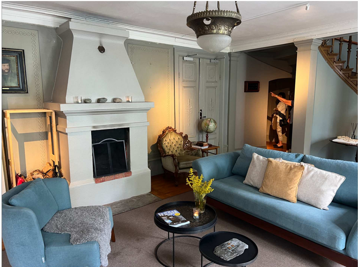
Detta möts man av direkt man stiger in från huvudentrén.