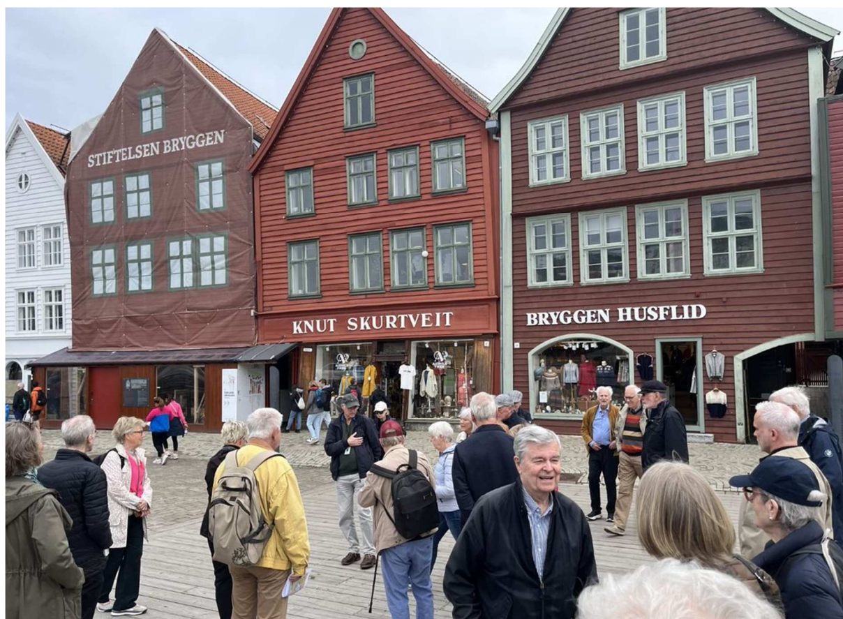
Vi fick en mycket bra inblick i historien bakom handelshusen i Bryggen-kvarteren och Bergenshus.