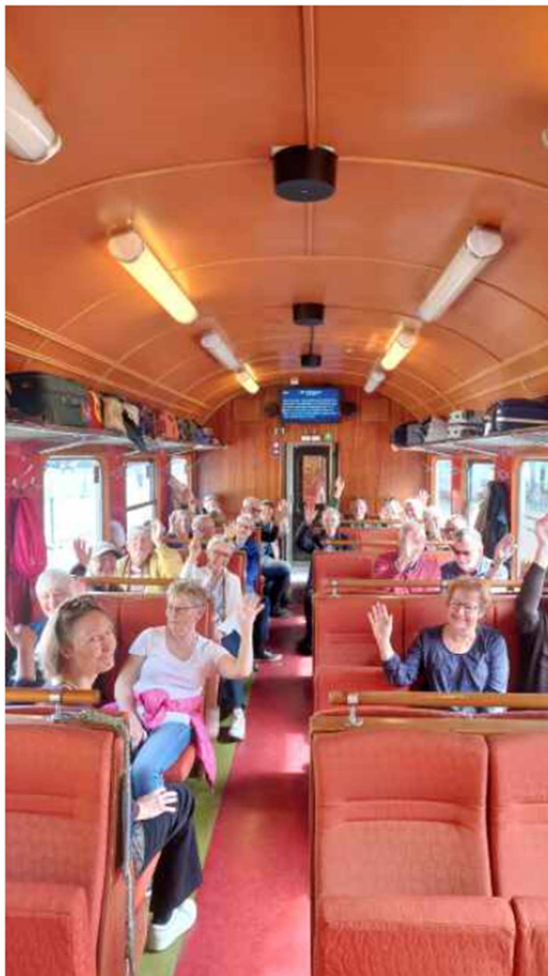
Vi hade egen kupé i tåget