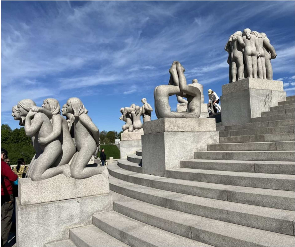
V fick en mycket insiktsfull och kunnig guidning genom Vigelandsparken.