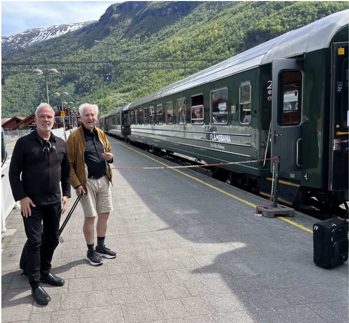
Resans fjärde dag inledes med tågresor längs den hisnande Flåmsbana.