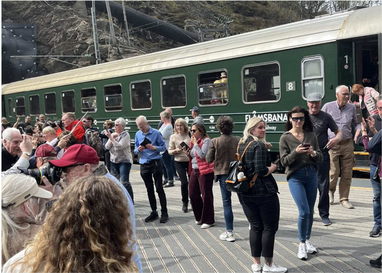
Väl uppe i Myrdal steg vi på tåget till Oslo.