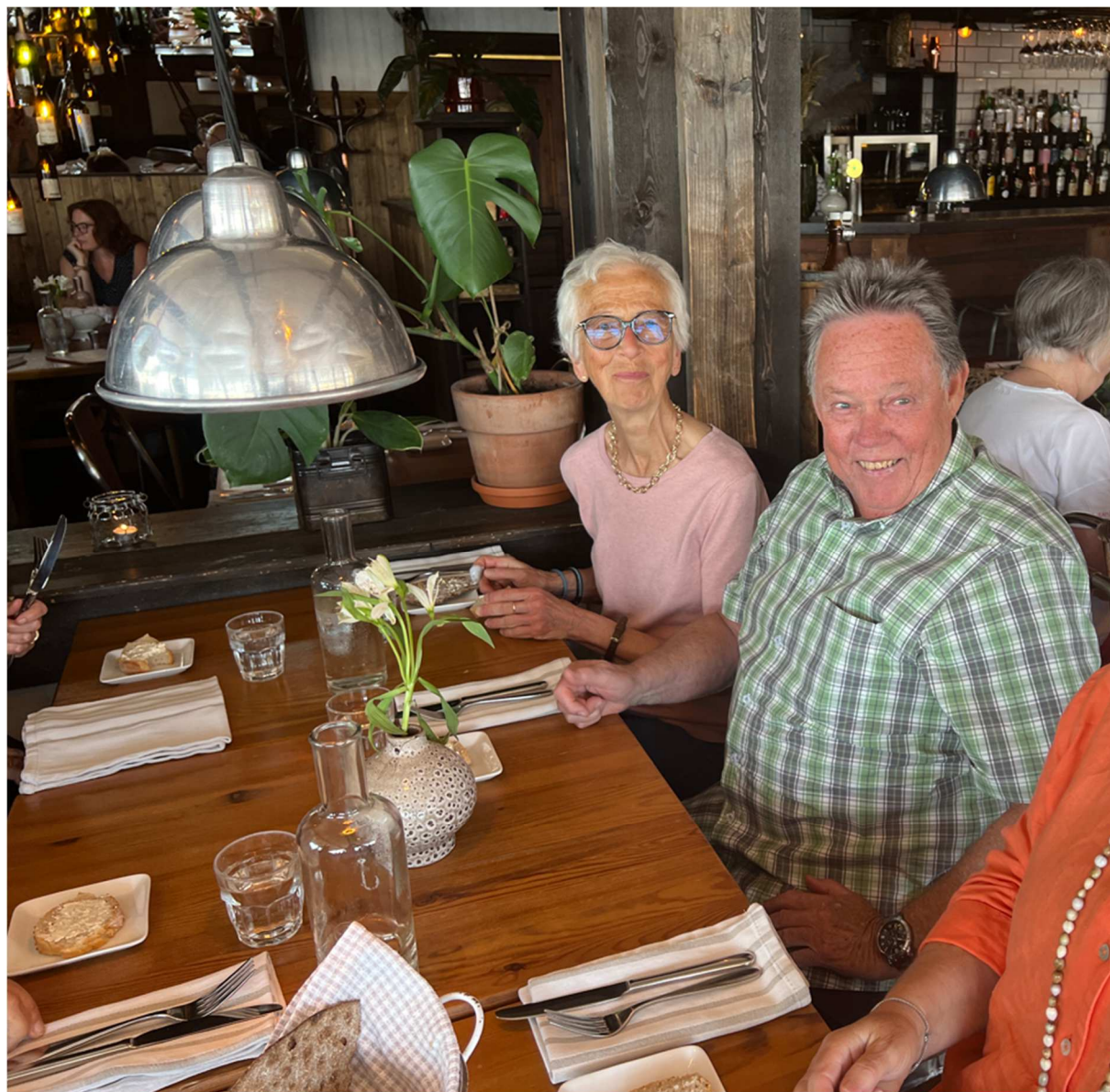
Ytterligare 2 som sällan missar en resa när SPF Järfälla har något på gång.