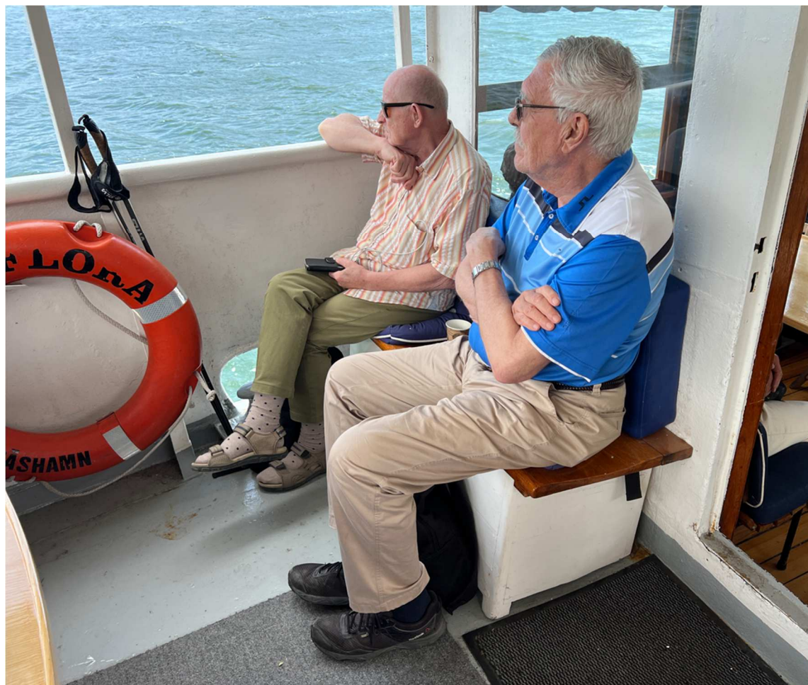
Även här fanns tydligen något att titta på.