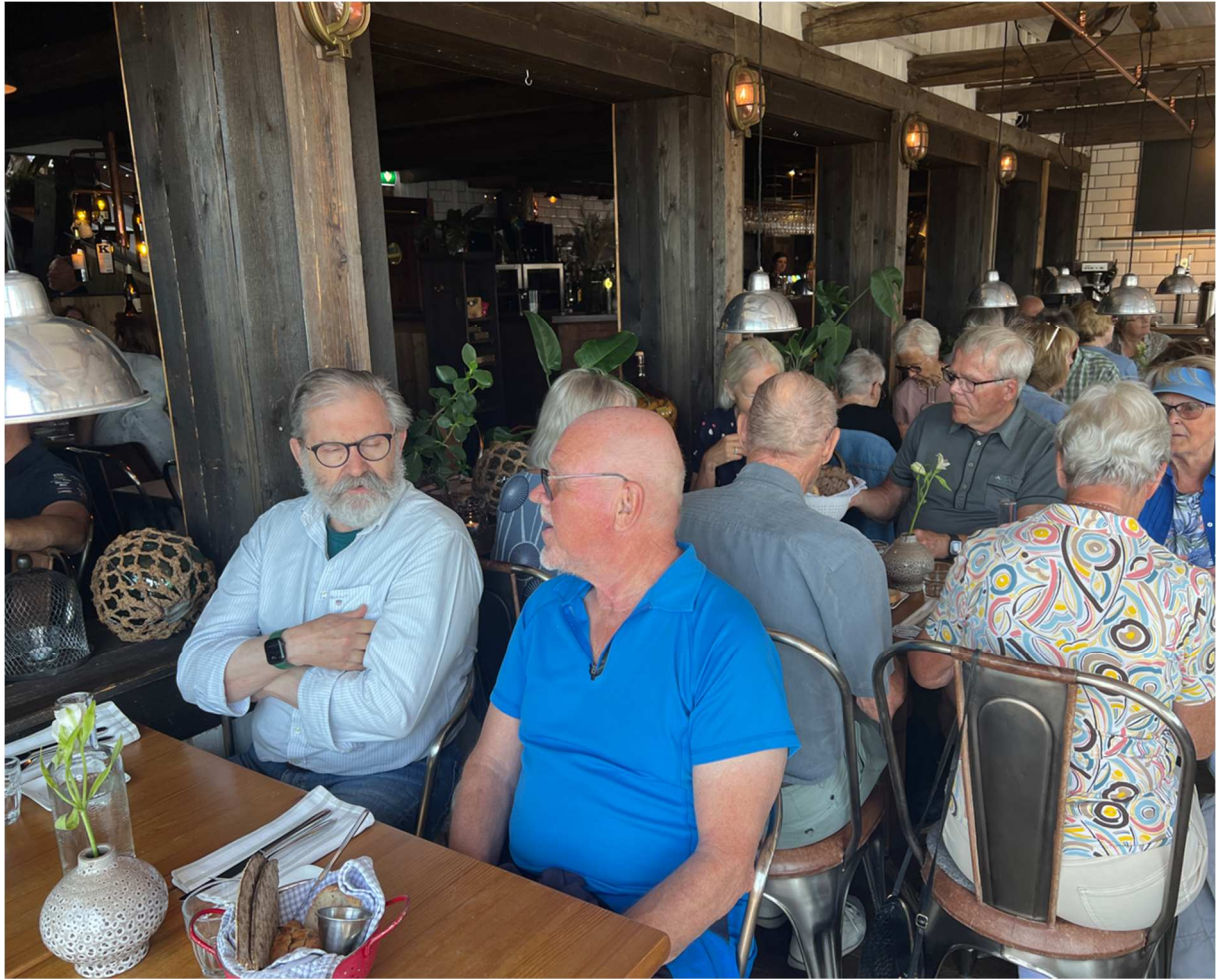
Fler som väntar på maten.