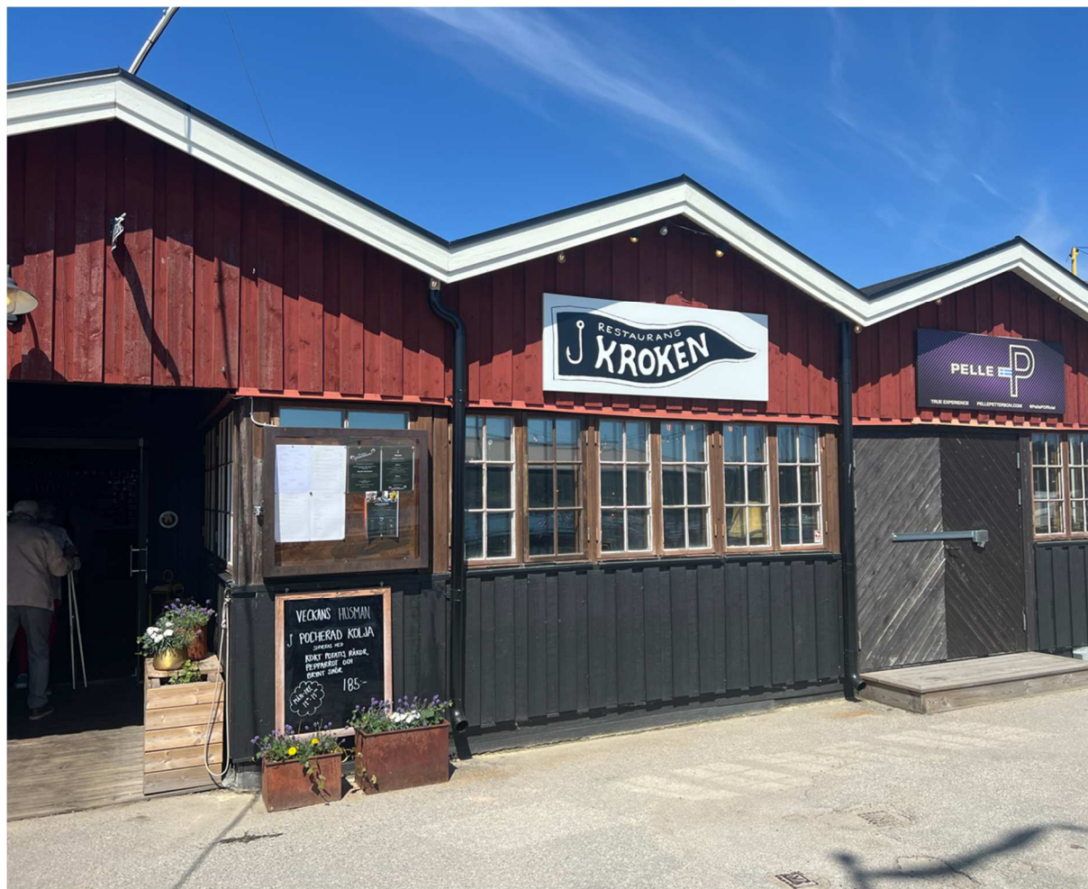
Dags för lunch som skulle inmundigas på restaurang Kroken i Nynäshamns hamnområde.