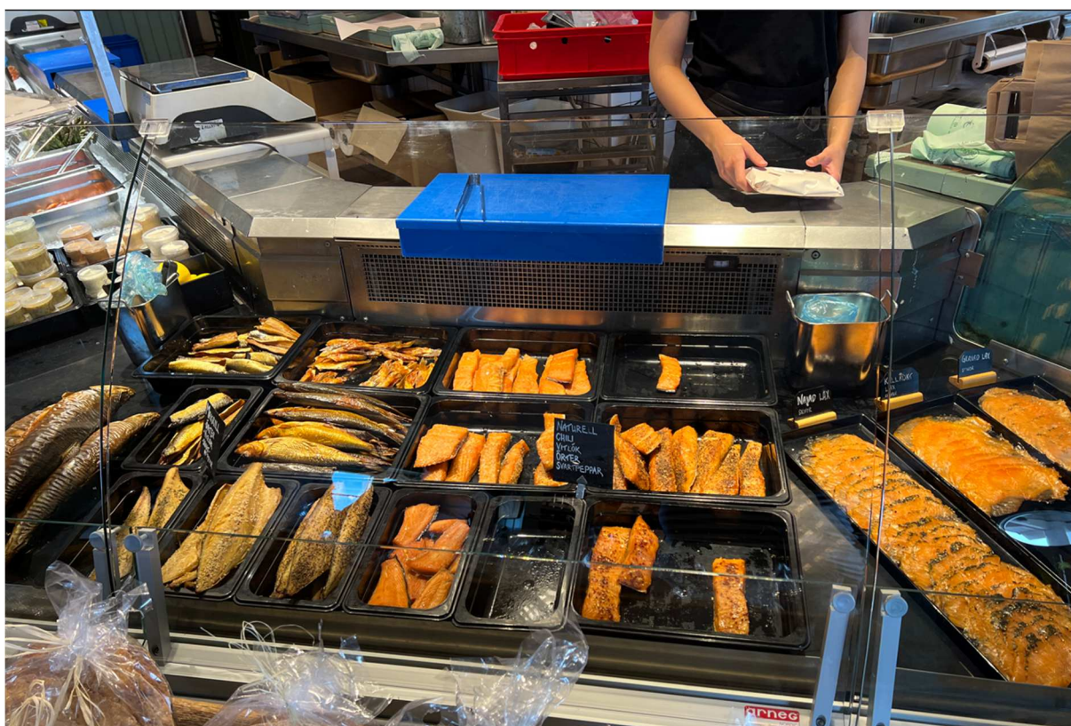
Här ett urval av läckerheterna som bjöds till försäljning i rökeriets affär.