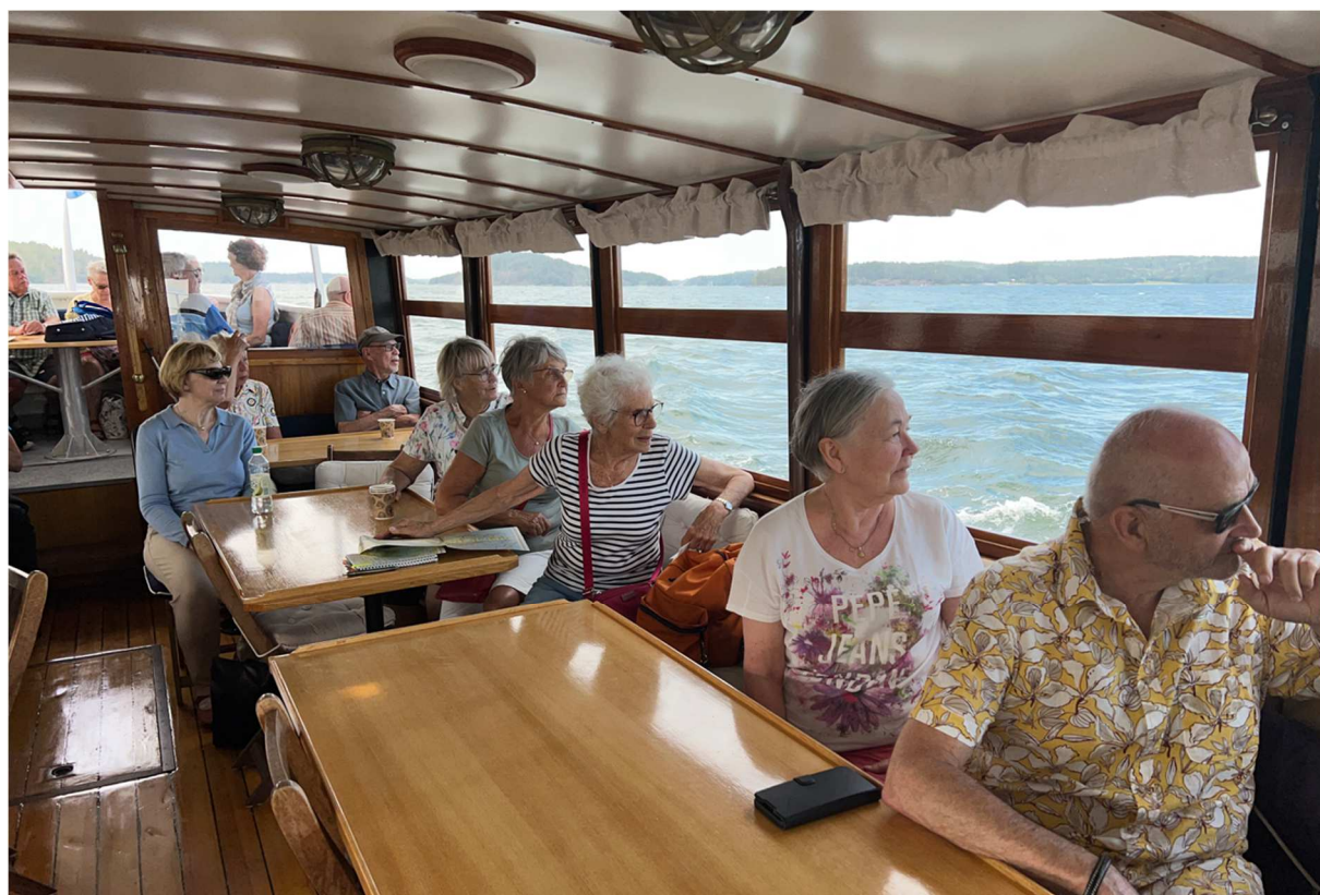
Nu stävar fartyget hem mot Nynäshamn men församlingen har tydligen uppfattat något intressant att titta på.