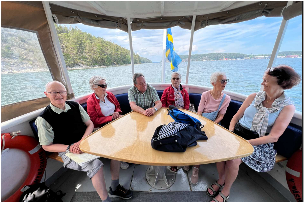
Några hade hittat platser längst bak i båten där man satt ute under tak.