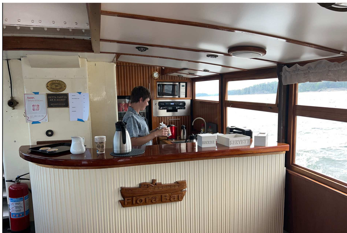
Denne man såg till att vi fick kaffe och mazarin.