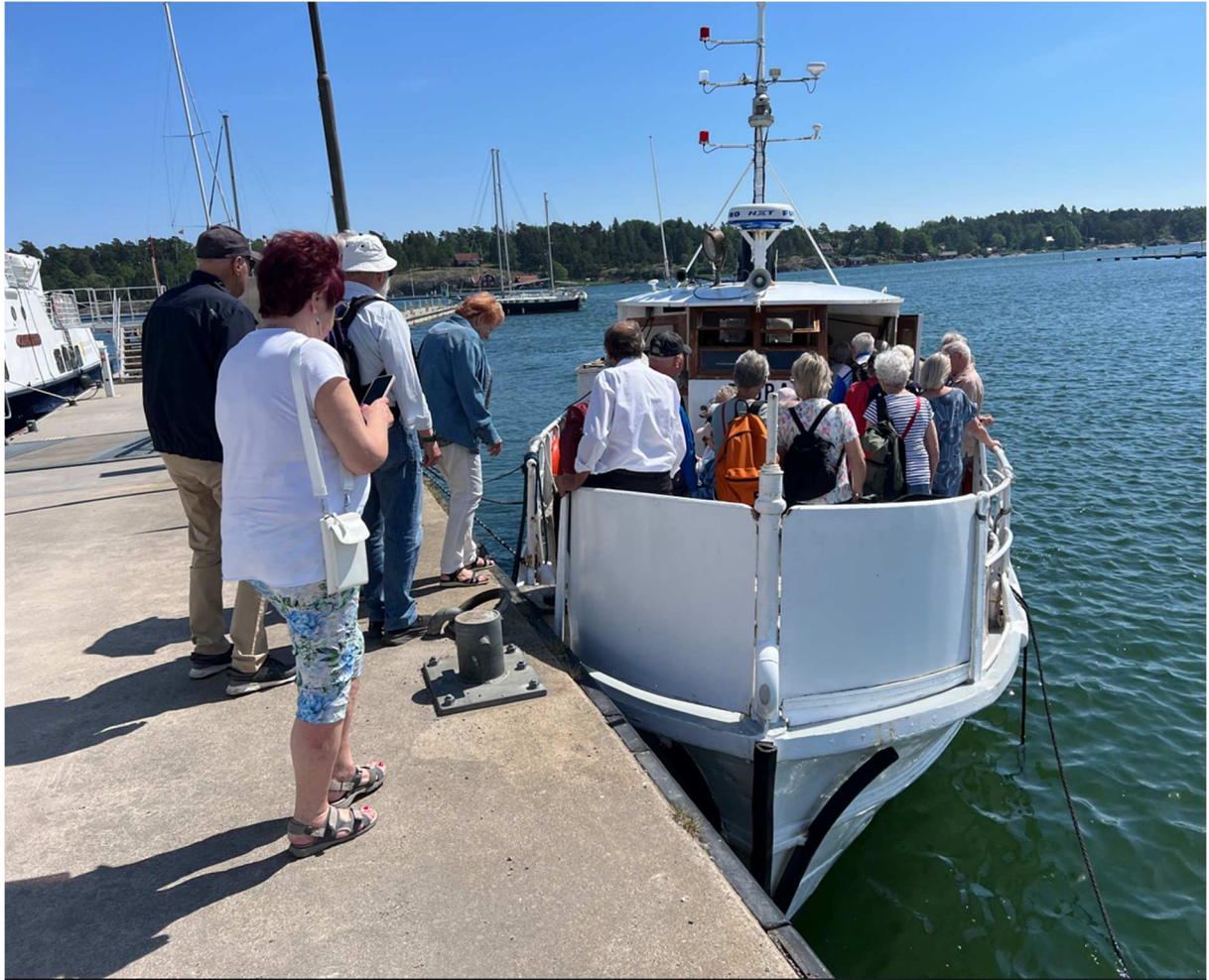
Ombordstigning. Reseledaren övervakar att alla kommer med.