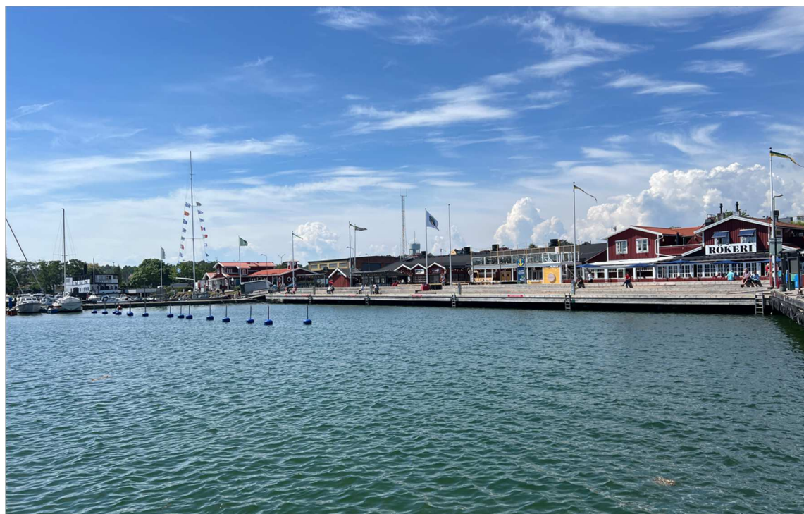
Nu är vi snart tillbaka där vi började färden. Till höger i bilden står det Rökeri. Det var nästa mål efter redan med Flora.