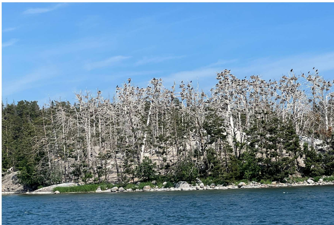
Här en bild på skärgårdens stora bekymmer. Skarvfågeln som brett ut sig i Östersjöområdet. En fullvuxen skarv äter ca 8 kilo småfisk om dagen och dessa fåglar finns i miljontals.