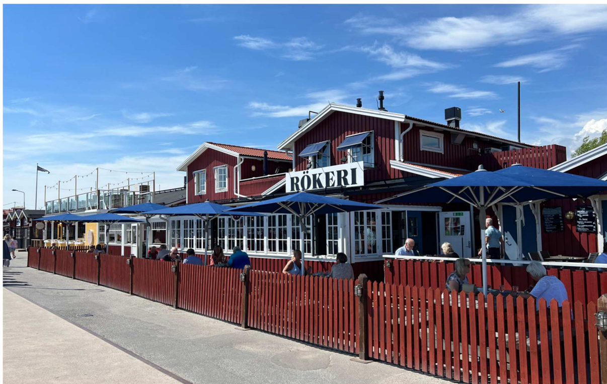
Där det finns fisk så finns det rökeri. Nynäshamn skiljde sig inte på den punkten.