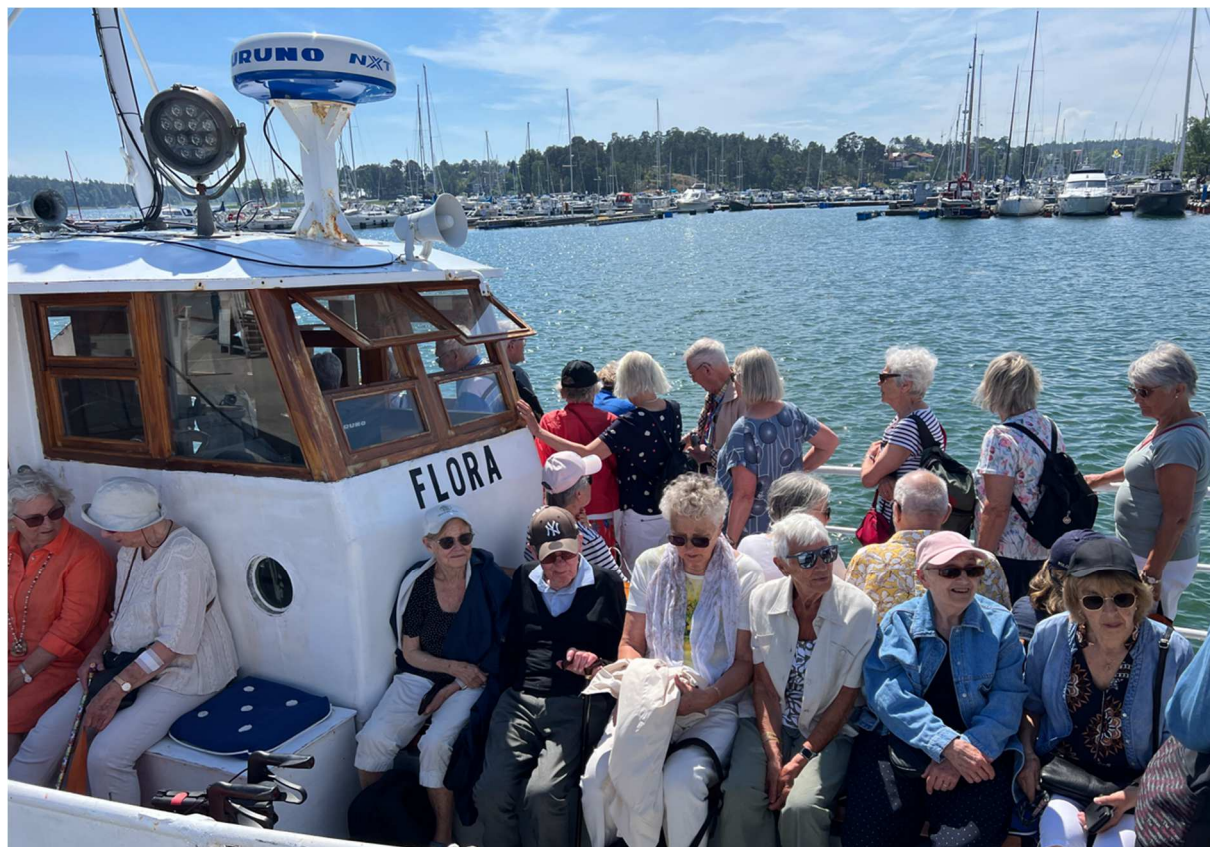
Vädret var som nämnts underbart så uteplatserna blev snabbt upptagna.