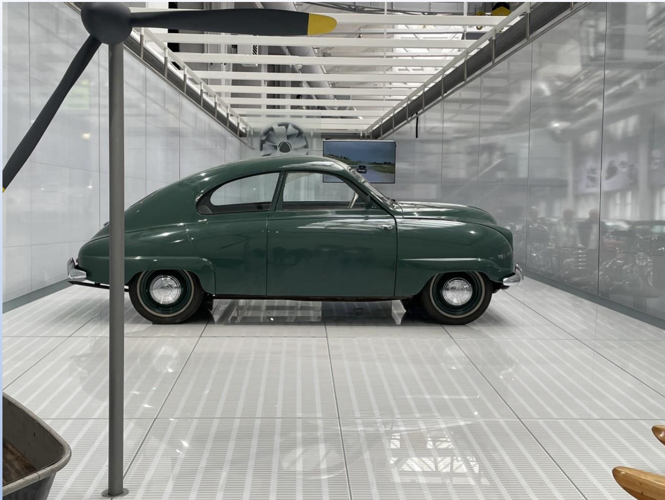
Besök på Saab museet Första och sista SAABEN