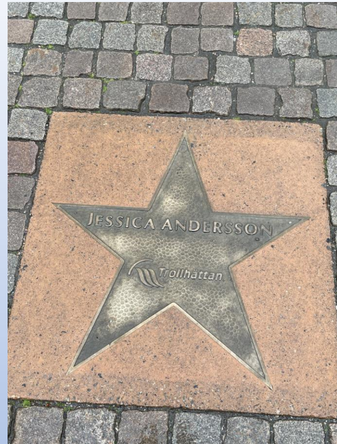
Några av de kända utplacerade på trottoarerna