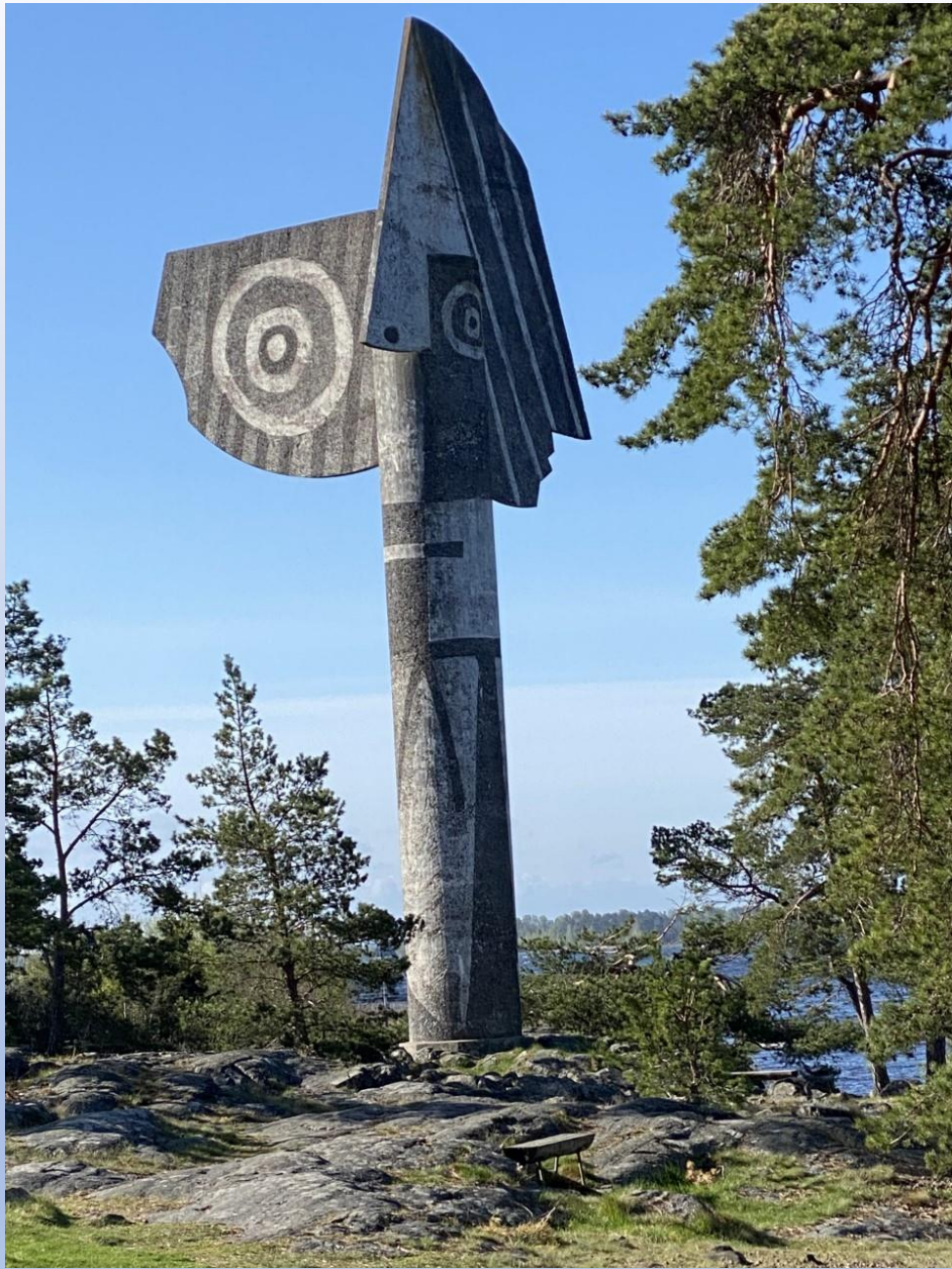
Picasso statyn i Kristinehamn