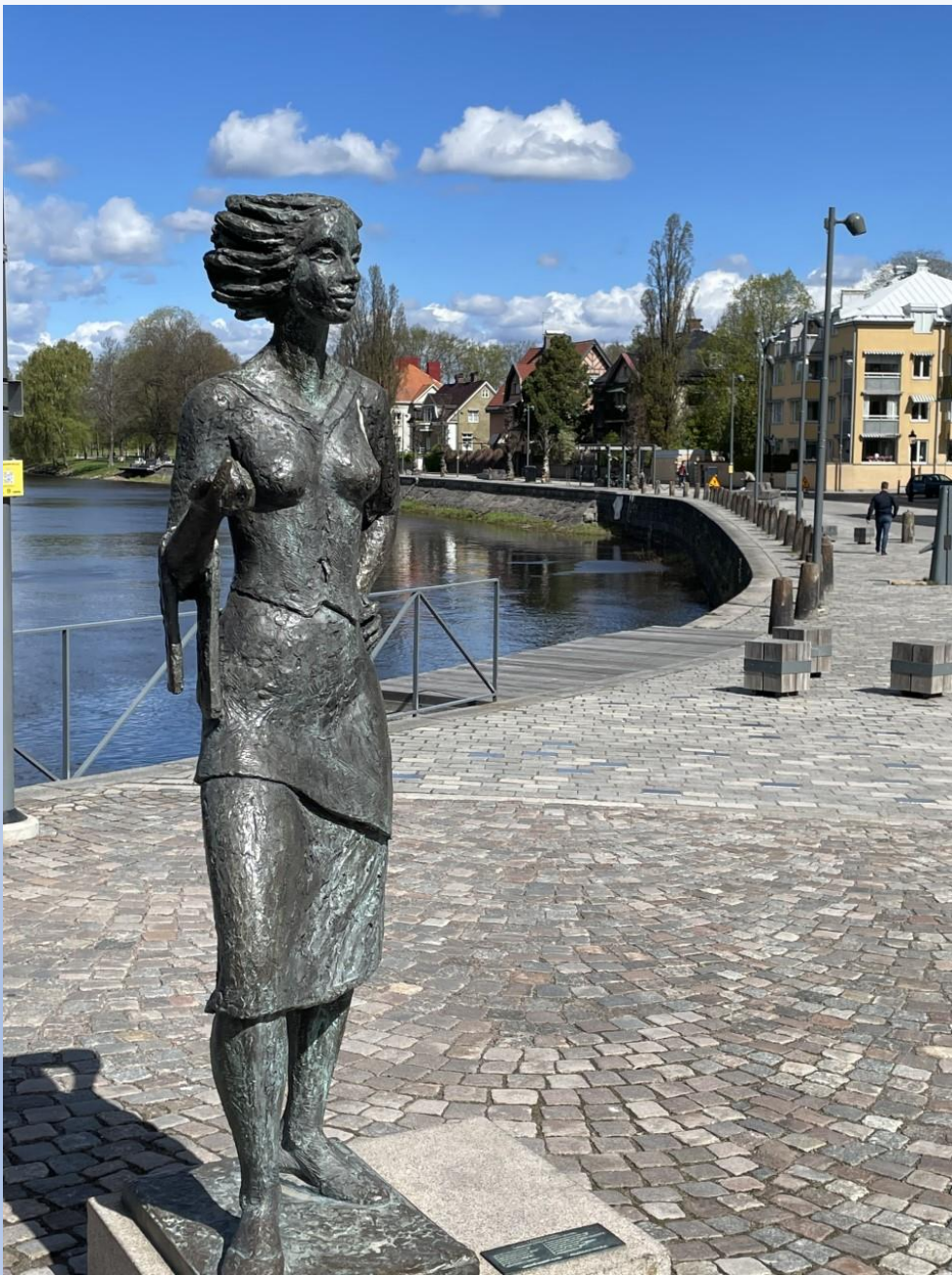
Sola i Karlstad