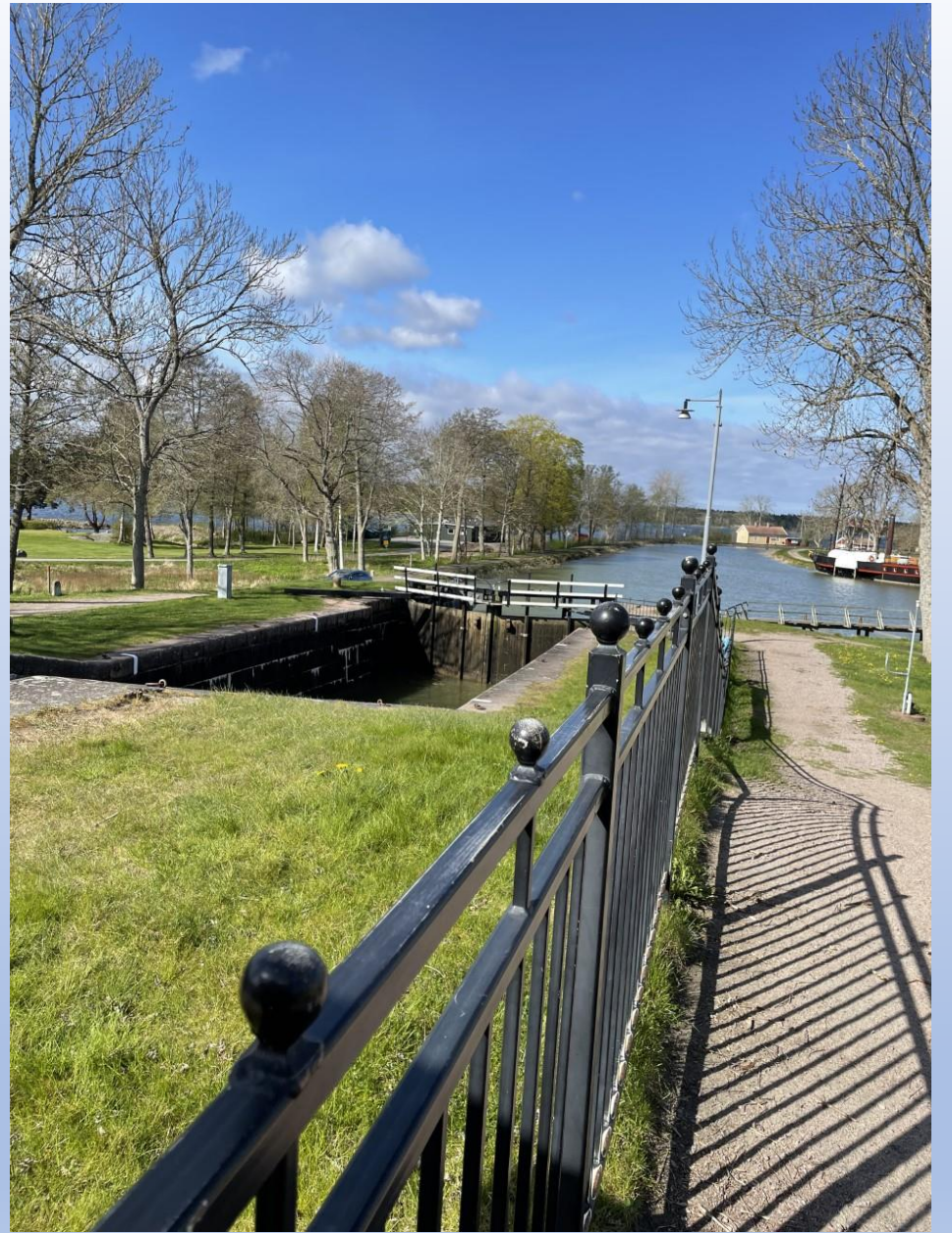
Sjötorp Göta kanal