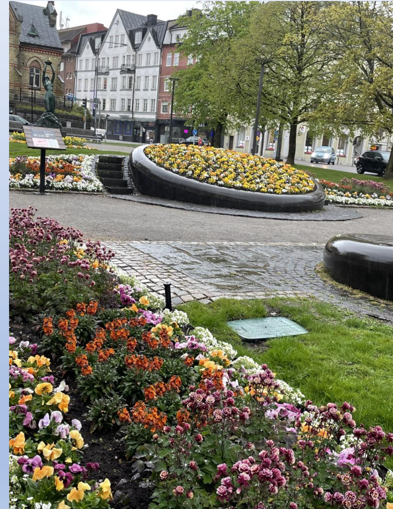
Strax utanför hotellet i Trollhättan