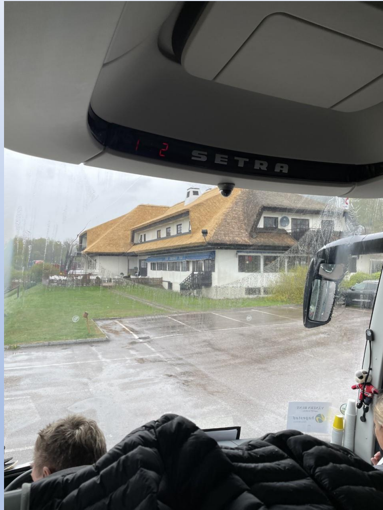
Första lunchstället vid Rasta Lilla Edet

SPF Kabusa startade resan mot Vänern Runt i Nybrostrand kl 07.00. Hagestakaffe på Glumslövs backar, därefter mot Göta Älv och till Scandic Swania i Trollhättan. Vår guide visade runt i stan.