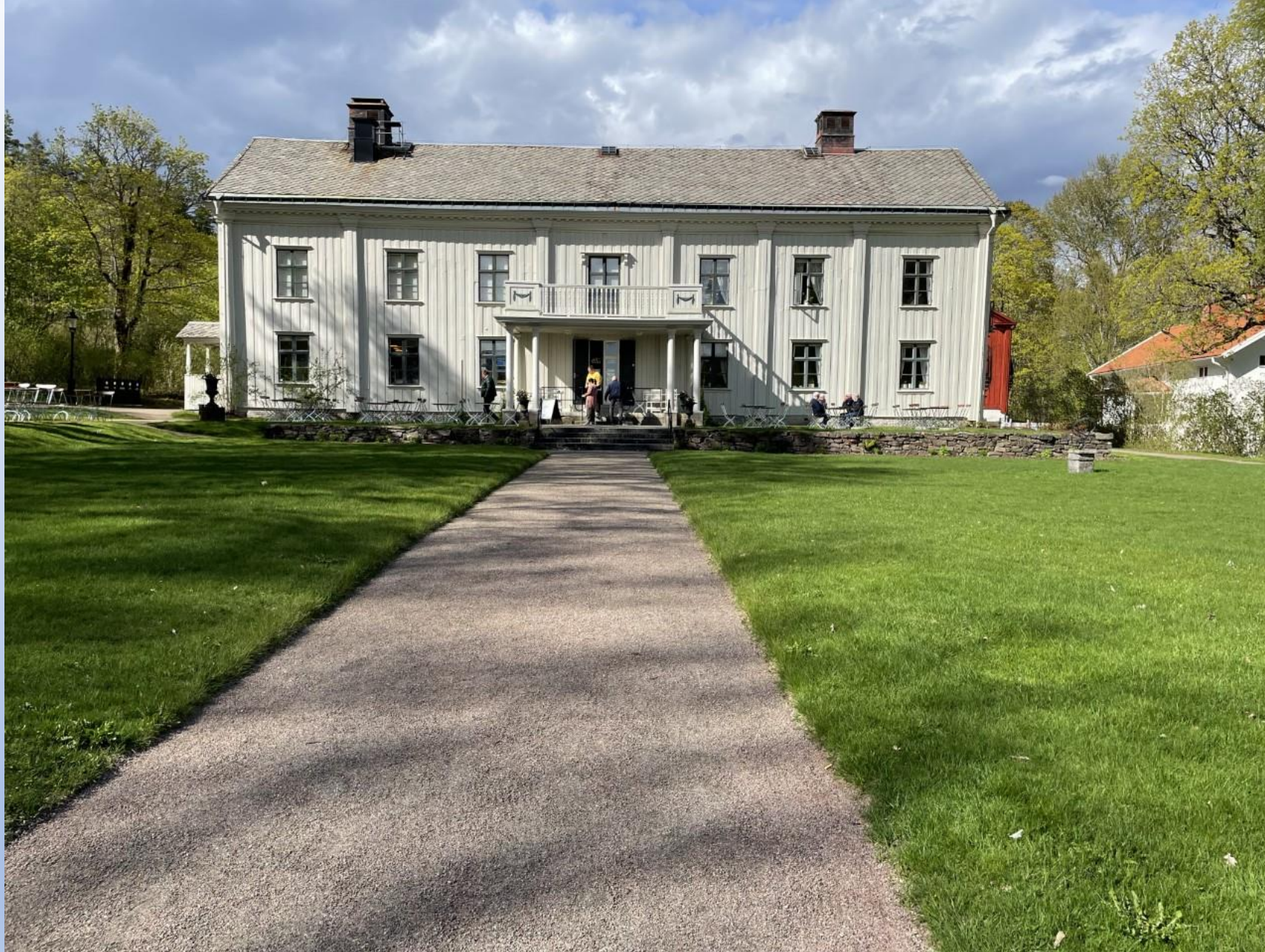
Frödings Alsters herrgård där vi blev guidade