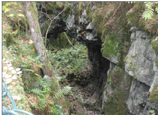
Här kunde man titta ner i Nils-Torstensgruvan. Det är den sist nedlagda gruvan i området (1906).

Det var en helt underbar skogsvandring, alldeles tyst förutom suset i träden. Vi passerade många gruvhål, alla mycket väl inhägnade.