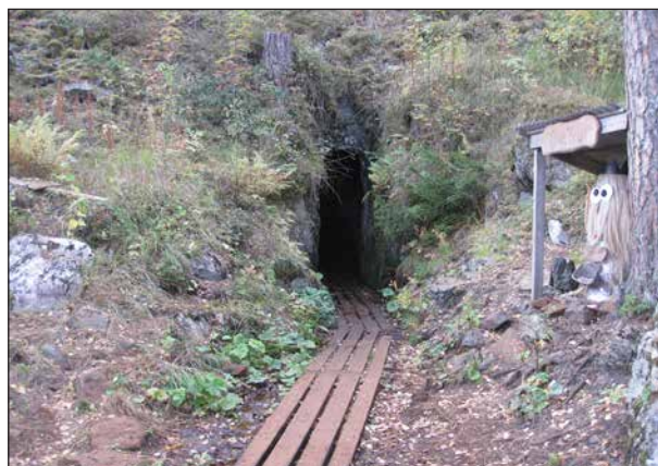
Ingången till Tilas stoll som hade förbindelse med flera gruvor.

Men även den här vägen blev lång och för mig tyvärr alldeles för ansträngande, så jag orkade inte ända fram. Sittande på en mossig sten vilade jag tills Allan kom tillbaka. Han hade gått fram till Tilas stoll och en bit in i den.