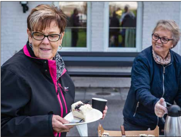
Tårta naturligtvis! Den var både god och vacker.

Sammanhållningen och hjälpviljan hos publiken var stor och man ville gärna hjälpa varandra att få fiket utan att besvära funktionärerna. I samband med soundcheck före kalaset fick publiken komma med önskemål om musik som framfördes av vår musikanter.