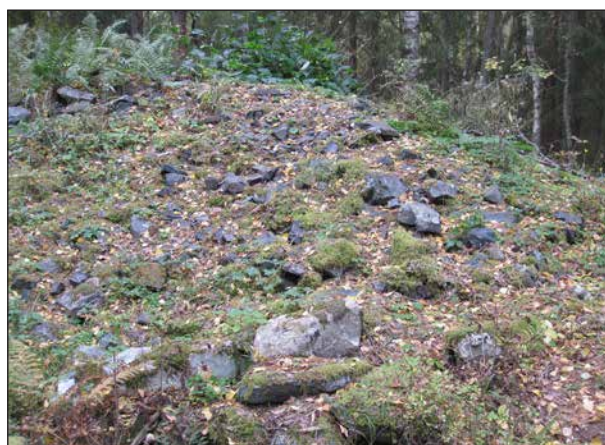
Sådana här lämningar från verksamheten går man förbi.

Men även den här vägen blev lång och för mig tyvärr alldeles för ansträngande, så jag orkade inte ända fram. Sittande på en mossig sten vilade jag tills Allan kom tillbaka. Han hade gått fram till Tilas stoll och en bit in i den.