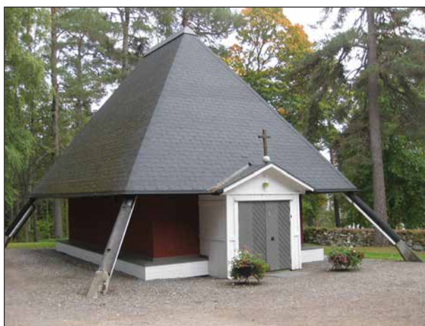
Kapellet vid kyrkogården nära sjön Yngen.

Vi började med en tur i bil till kyrkogården som ligger vackert vid sjön Yngen. Kyrkogården anlades som begravningsplats för gruvarbetare. Kapellet har byggts senare.