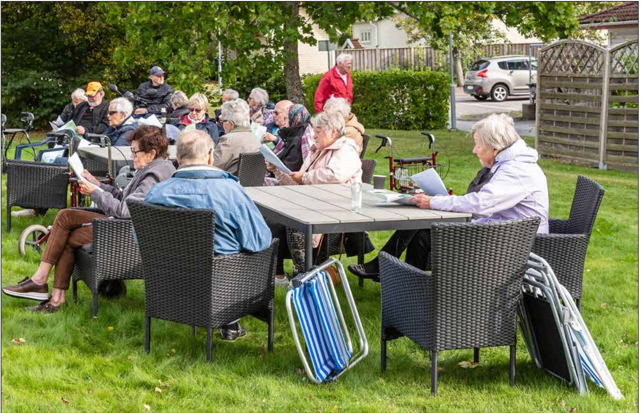
Tillsammans mot ensamhet, utombus en fin höstdag, kan det bli mycket bättre?