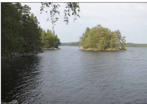
Utsikt över sjön Yngen från rastplatsen.

Det var en lång vandring tillbaka som krävde flera vilopausar för min del. Vi var båda ganska trötta efteråt, men det kändes ändå bra att ha gått där. För den som har lite bättre ork är det verkligen en plats att rekommendera.