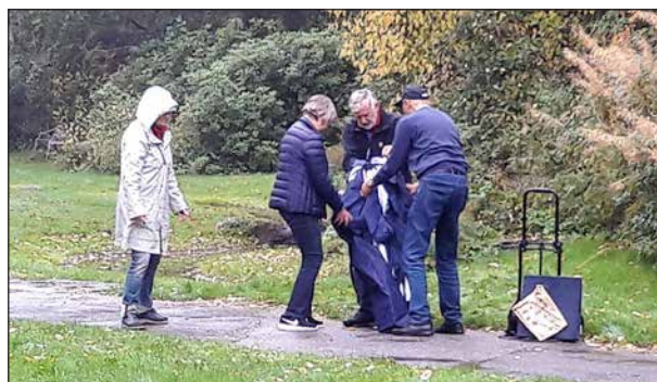
Allt är inte över bara för att månadsmötet är slut. Då är det dags för några att städa upp.