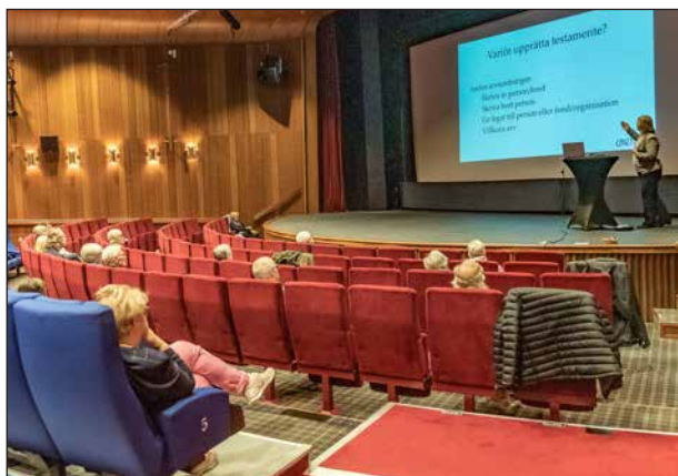
Glest besatt i bänkarna precis efter gällande regler.

Dagens vetgiriga veteraner är en del av projektet ”Tillsammans mot ensamhet”, så föreläsningen i Folkets hus var öppen för alla. Det var 34 personer föranmälda och vi höll Coronaavstånd som man ska göra.