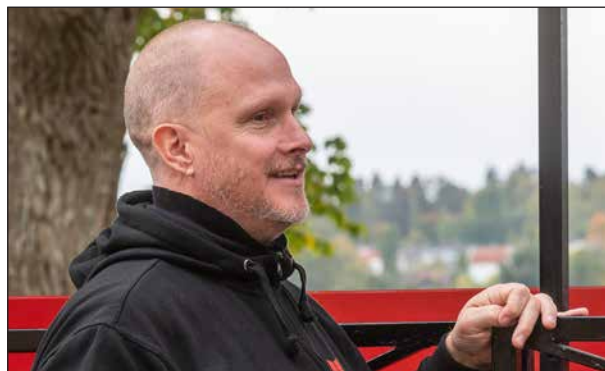
En glad lokförare sätter extra guldkant på utflykten.

Mobilkameror kom fram och det fotades över den spegelblanka sjön, ”Guldagneta” sittande i sin kanot, vid träden samt sittande gäster. Innan tåget vände hemåt med den andra ”besättningen” var det flera som uttryckte sin glädje över utflykten och sade att det var guld värt att de fått vara med. Det kom även en liten knatte som ville åka med tåget vilket han gjort flera gånger tidigare. Han fick veta vart tåget skulle och gick vidare istället.