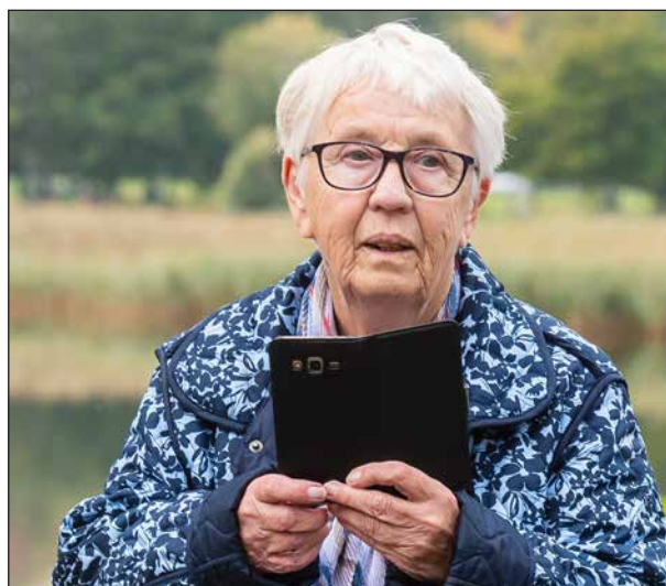
Många fick med sig bilder hem från tågutflykten.

Mobilkameror kom fram och det fotades över den spegelblanka sjön, ”Guldagneta” sittande i sin kanot, vid träden samt sittande gäster. Innan tåget vände hemåt med den andra ”besättningen” var det flera som uttryckte sin glädje över utflykten och sade att det var guld värt att de fått vara med. Det kom även en liten knatte som ville åka med tåget vilket han gjort flera gånger tidigare. Han fick veta vart tåget skulle och gick vidare istället.