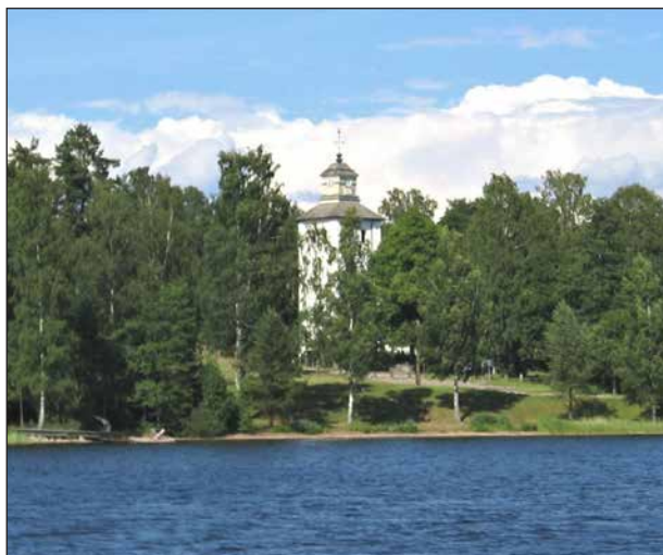
Värmskogs kyrka, vackert belägen vid Värmeln.

Värmskogs kyrka är också intressant, dels med tanke på läget och byggnaden, dels dess historia. Kyrkan byggdes i början av 1800-talet efter att den tidigare kyrkan hade brunnit ned 27 juli 1799.