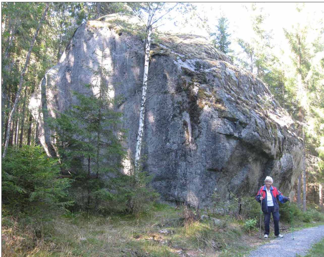
Artikelförfattaren är bara med på bilden för att visa stenens storlek. Man känner sig ganska liten.

Värmskogs kyrka är också intressant, dels med tanke på läget och byggnaden, dels dess historia. Kyrkan byggdes i början av 1800-talet efter att den tidigare kyrkan hade brunnit ned 27 juli 1799.