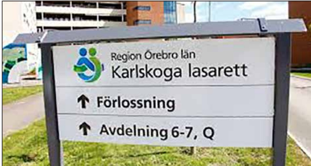
Bara ett nostalgiskt minne?

Med tanke på allt som nu händer kring sjukvården Karlskoga och i regionen blir man lite förundrad och bekymrad. Det började med att våra barnmorskor fick ställa upp för Universitetssjukhusets BB under semesterperioderna och nu är förlossningen i Karlskoga stängd tills vidare.