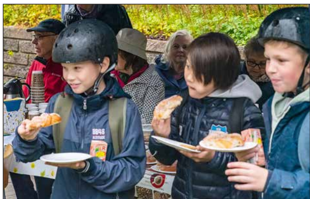
Tre glada blivande pensionärer. Kan man vara annat än belåten när det bjuds på fika?

Med tanke på att det är pandemitider fick musikanterna stå under ett tält på ena sidan av dammen samtidigt som de flesta i publiken var väl utspridda på andra sidan dammen där även kaffetältet fanns.