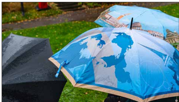
Bildbevis på att det var en regnig dag.

Det var ett möte i pandemins tecken och en del av projektet ”Tillsammans mot ensamhet”. Vi var 34 föranmälda denna milt sagt regndisiga dag i Ekmandalen.