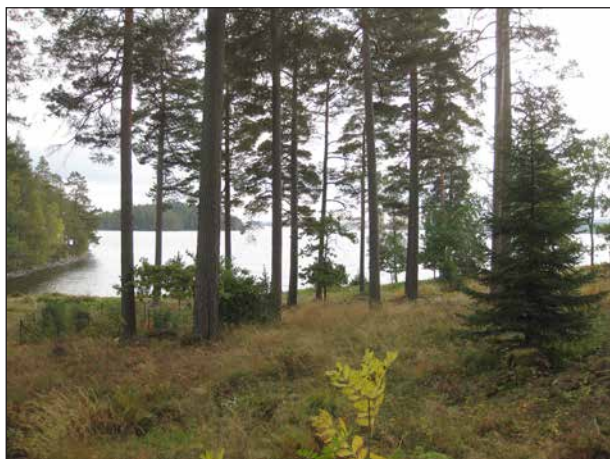
Fin utsikt över Yngen från den gamla kyrkogården.

Den 15 augusti hade SPF Seniorerna planerat en utflykt som skulle gå till Filipstad med omnejd. Vi vet ju hur det gick. Allt sådant blev inställt. Man hade planerat en heldag med många aktiviteter. En vacker eftermiddag i slutet av september gjorde vi en del av den utflykten. Vi satsade direkt på Högbergsfältet nära Persberg. Det är ett av landets största gruvfält, där malm har brutits i hundratals år.