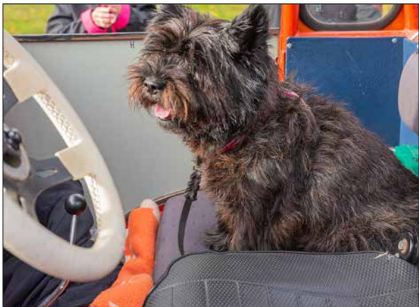
Tänk att få sitta framme hos lokföraren!

Denna dag gick tåget från 3 stationer, nya Bergmästaren var först ut. Här fick vi med en extra passagerare, en söt fyrbent vän som följde med matte på resan.