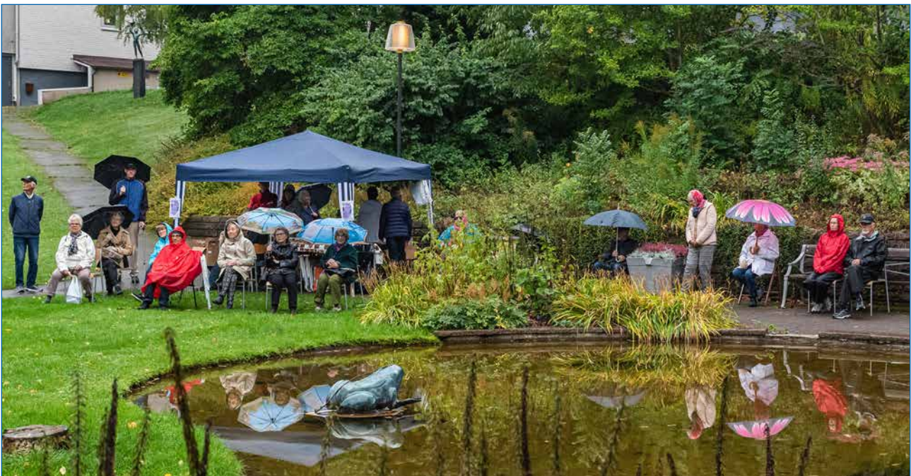
Ganska många trotsade regnet och kom på månadsmötet. Läs mer på sidan 6.