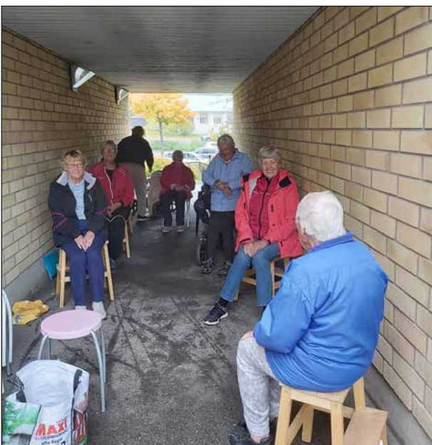
Det regnade när man senast hade sittgympa utombus vid Solbringan. Men skam den som ger sig!