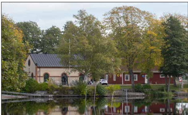
Gamla pumphusets kafé, idylliskt inbäddat i grönskan.

Färden gick via Mässen, strandbadet, en tur längs Möckelns strand till gamla pumphuset där alla bjöds på fika utomhus i det vackra vädret.