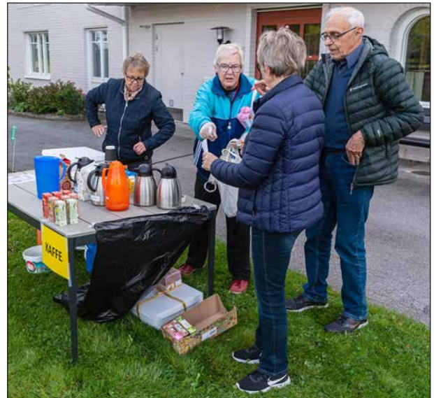
De som ordnar aktiviteter och kaffe har mycket att göra.

Eftermiddagen avslutades med information om kommande evenemang, bl.a. en kommande resa