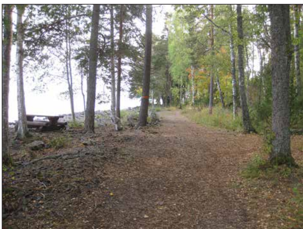
Den här fina rastplatsen ligger alldeles intill Tilas stoll.

Inne i stollen syns spår av den gamla metoden att bryta berg, så kallad tillmakning. Man eldade med ved intill bergväggen så att berget blev sprött och sprack. Så småningom övergick man till så kallad sprängolja. Den var snabb och effektiv men åstadkom många dödsolyckor. När dynamiten kom blev verksamheten säkrare.