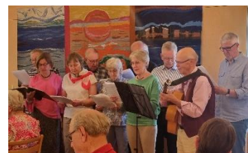
Vår egen Allsångskör underhåller.