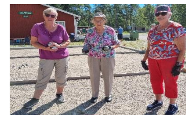
Boulespel på Enstaberga IP.

Vi har Månadsmöten, Vandringar, Boule, Canasta, Bad, Studier, Resor och mycket mer.