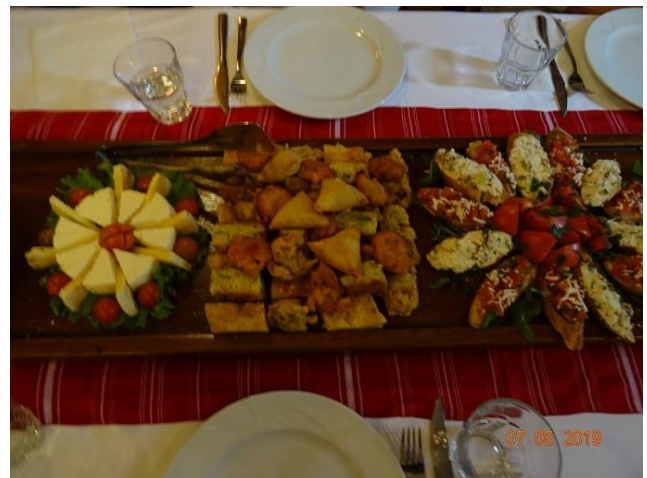
7/5 Mat i Albanien: Vaktelëg i bröd med yoghurt, olika maträtter på planka