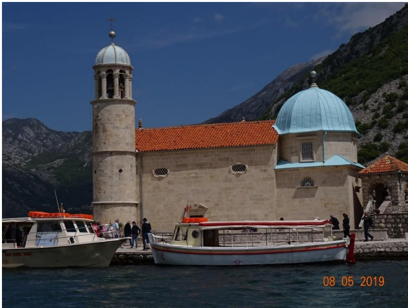
8/5 Båt på Kotorbukten i Montenegro till Lady of the Rocks & St George.