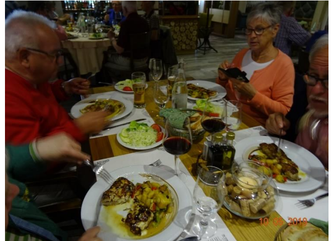
Mycket mättande lunch 10/5

10/5 Passerar sjön Skadar i södra Montenegro. Sedan förbi flygplatsen med den stora "Vingården 13 juli" nära huvudstaden Podgorica/Podgora och underjordiska rum för lagring av vin. Snabbprovning och inköp av deras vin Vranac. Mättande lunch på restaurang Manje Knjaz se bild. Retur på väg under ombyggnad. Avskedsmiddag på Ancora i Herceg Novi. Zlatko avtackas. 11/5 tidig hemresa efter en mycket omväxlande och spännande resa. / Palle