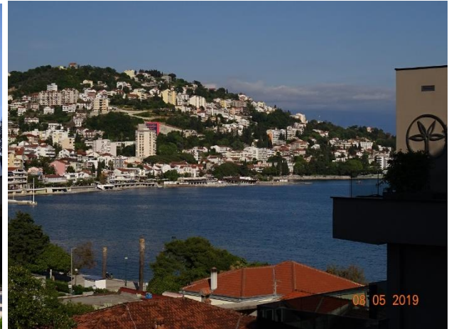
Palmon Bay Hotel i Montenegro med utsikt från ett av rummen.