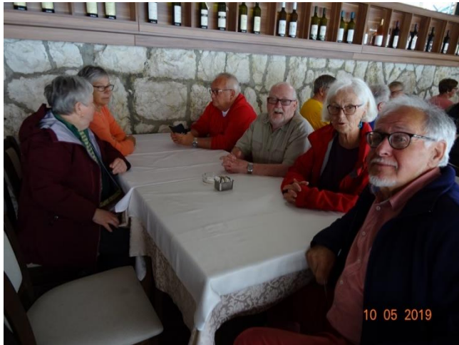
Fika väntar vid den stora sjön Skadar.

Besök i Kotor Världsarv 9/5 med kryssningsfartyg inne i staden! Bussklättring genom 25 hårnålar och hårsån till mötande buss. Behövlig lunch på ZORA med torkad skinka (prosciutto), korv och rött lantvin i Cetinje, Montenegros gamla huvudstad, sedan Nikolas I och fika med snabb promenad i regnet till bussen.