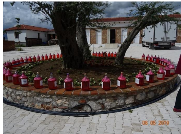
Agroturismo nära Skhodër, Albanien med gäss och rosenbladsvatten.