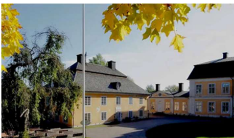
Vårdshuset Gammel Tammen

Österbybruk är ett välbevarat brukssamhälle. Redan på 1400-talet bedrevs järnhantering i trakten och på Gustav Vasas initiativ följde sedan en månghundraårig utveckling av järnhanteringen och Österbybruk. Idag möts besökarna av den typiska bruksstrukturen med raka gator kantade av arbetarbostäder och den ståtliga 1700-tals herrgården med park, stallar och orangeri. I dess mitt finns den enda nu fungerande vallonsmedjan i världen. Där smiddes järnet till det så eftertraktade stångjärnet som gjorde Österbybruk känt långt utanför Sveriges gränser.