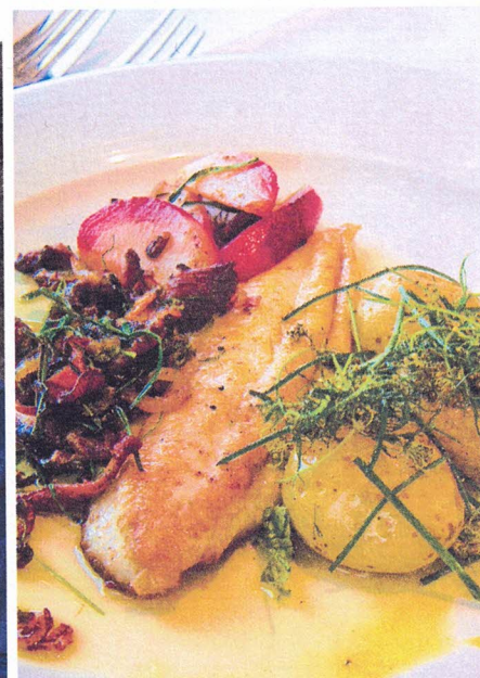
På tallriken - Delikat grönt från trädgårdsodlingen