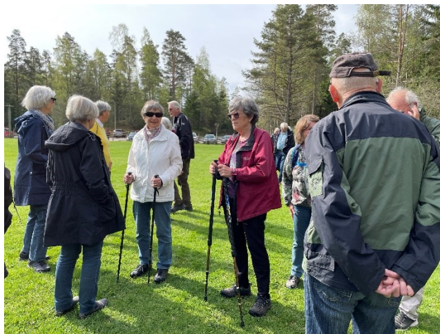
Samling vid orienteringstavlan för information om dagens aktiviteter

Efter promenaden samlades vi i klubbstugan för fika.