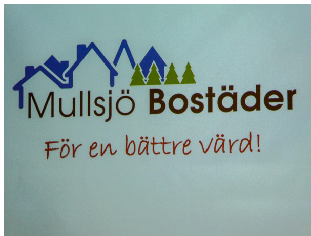
Mullsjö Bostäders logga