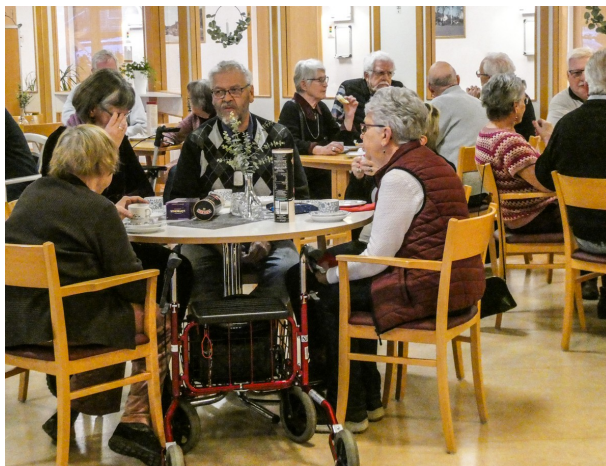
Medlemmar vid fikabordet