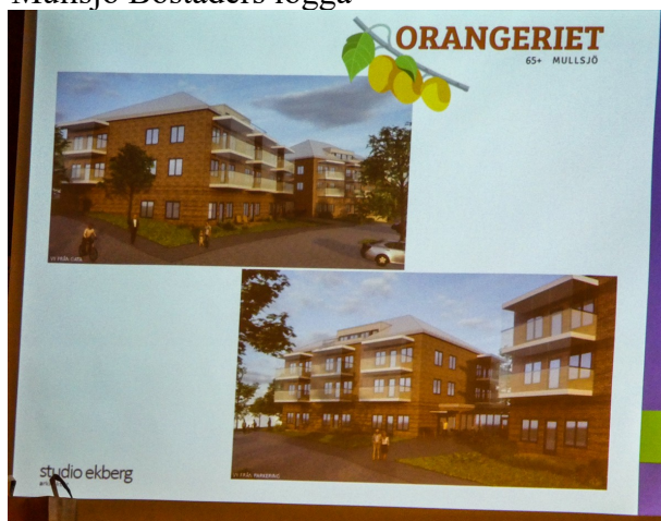
Tänkbar utformning av Orangeriet