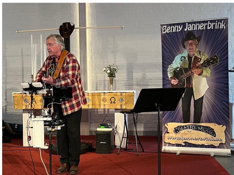
Månadsmötet med countrymusik.

Nedan kan ni se några foto från vårterminens aktiviteter.