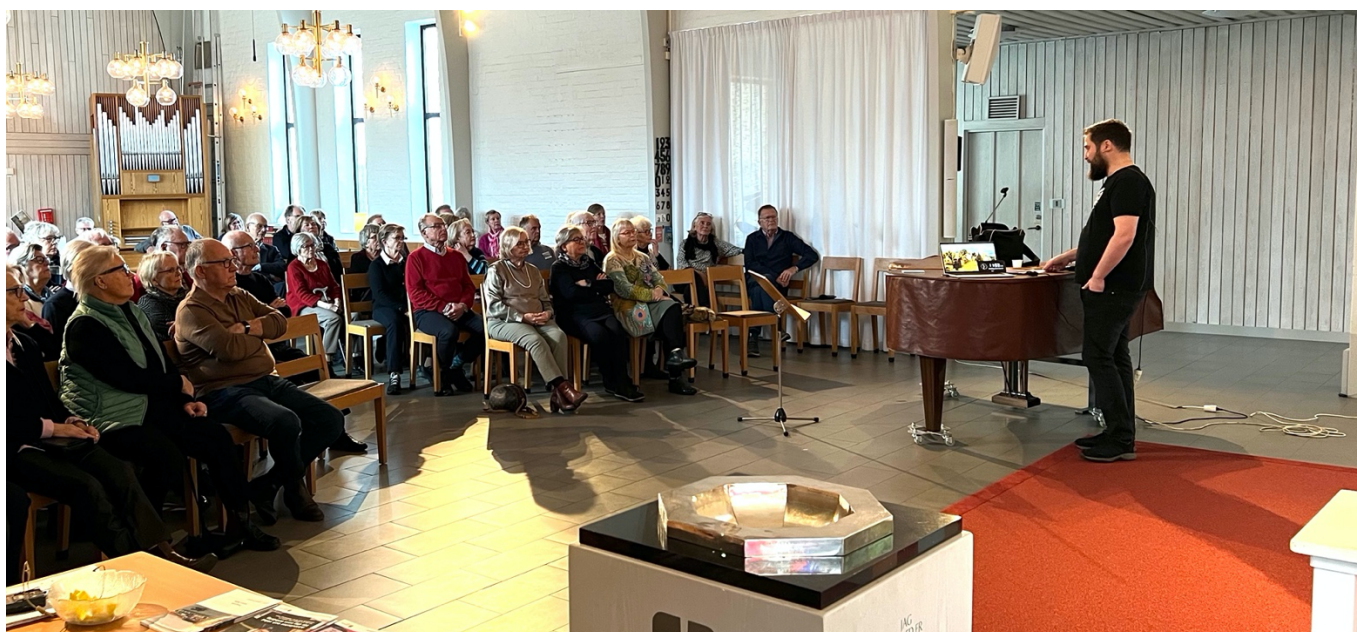
Månadsmöte med tema "Varför Göteborg borde kallas Lilla Glasgow."