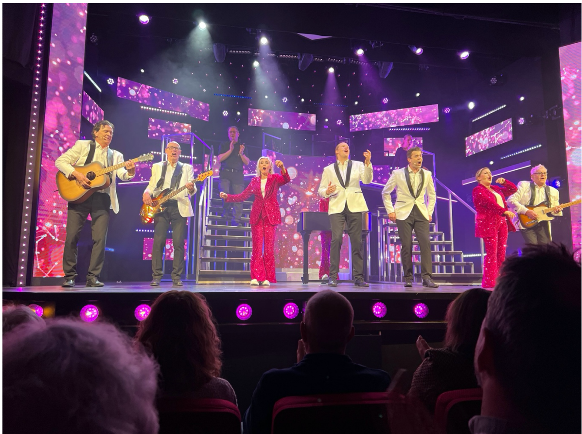
Falkenbergsrevyn januari 2024.